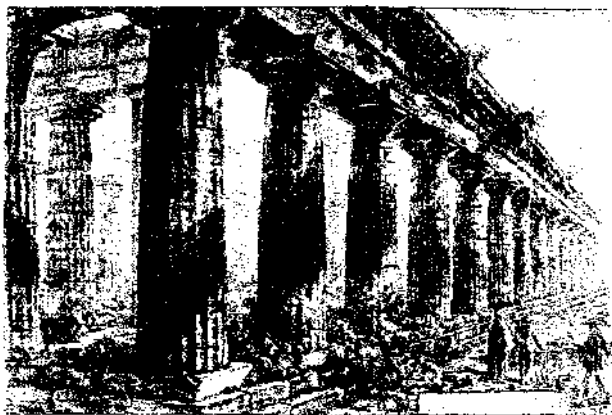
Малюнак 2 - Храм у Пестуме. Гравюра Піранезі

405). Фактычна, навуковец, які паўплываў на ўсю эстэтыку XX стагоддзя, яшчэ ў XIX стагоддзі папярэджваў аб неабходнасці захоўваць знакі часу, сляды яго ўздзеяння непасрэдна на фізічную паверхню будынка.