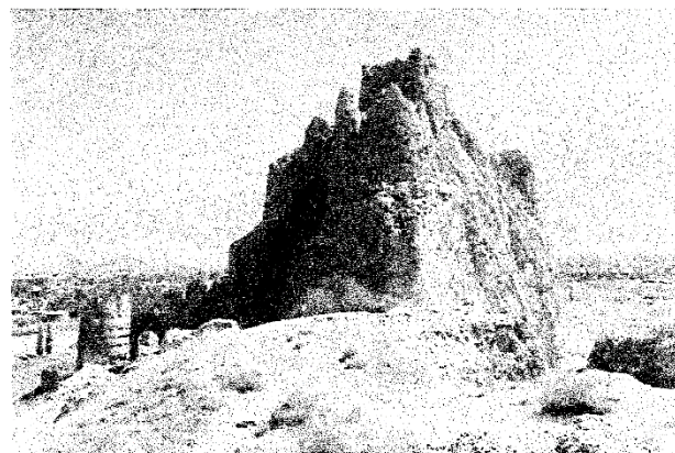
Малюнак 1 - Руіны крэпасці з эпохі Урарту ля горада Ван

Іншае значэнне мае ўплыў мастацкага стылю, у якім пабудавана гістарычнае архітэктурнае збудаванне. Ёсць формула Д.С. Ліхачова - "стыль выказвае духоўны клімат эпохі" (Мал. 1).