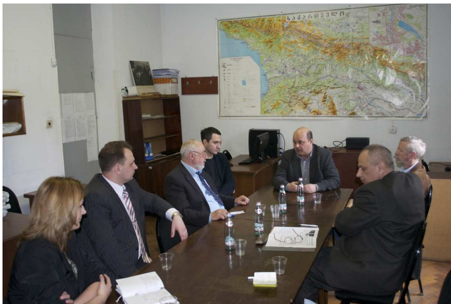
Рис. 3. Беларуская делегация на встрече с деканом географического университета Тбилисского государственного университета имени Иване Джавахишвили

Студенческое самоуправление является важным фактором высшего образования в Грузии. Один из примеров его влияния – протесты студентов Тбилисского государственного университета, требующих отставки ректора, которого они обвиняли в связи со спецслужбами, привели к его увольнению и назначению нового ректора.