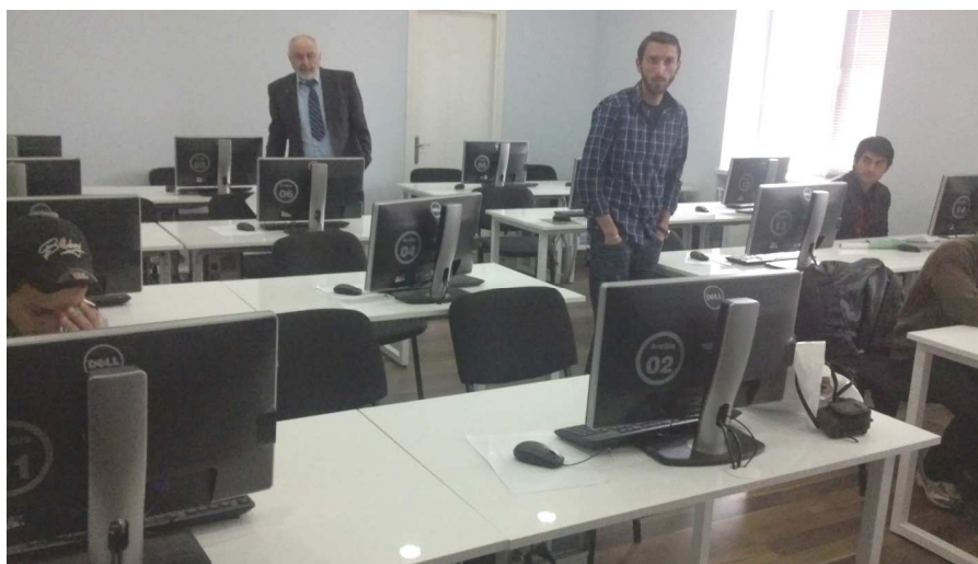
Рис. 2. В одной из аудиторий кафедры инженерной геодезии и геоинформатики

Топографо-геодезические работы не лицензируются, ими занимаются только частные компании. По состоянию на 2013 год количество таких компаний составляло 115.