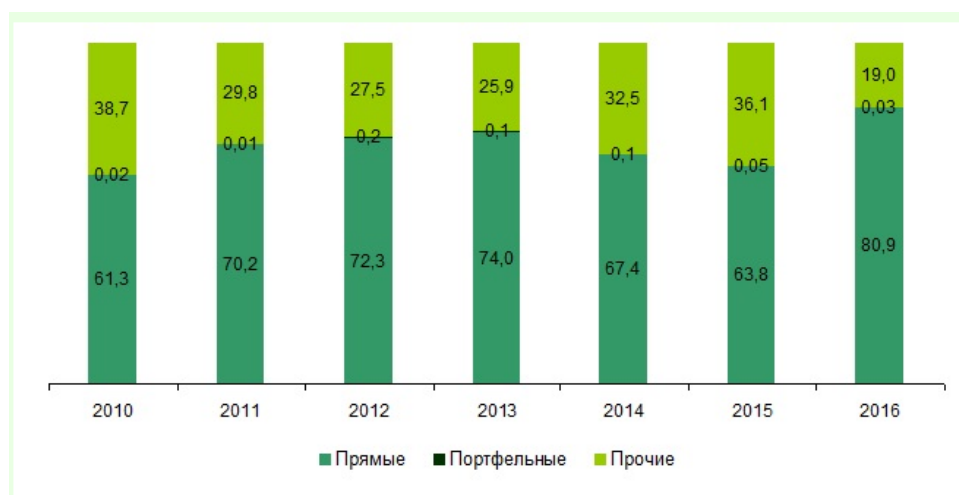
Рисунок 2 – Структура капиталовложений

Структура капиталовложений, поступивших от зарубежных вкладчиков в реальный сектор экономики Республики Беларусь (в процентах к итогу) представлено на рисунке 2.