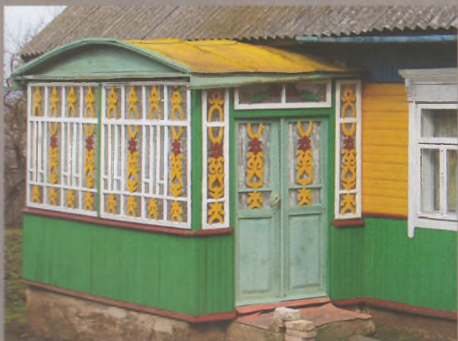
Рисунок 29 — Веранда жилого дома в Заозерье Несвижского р-на