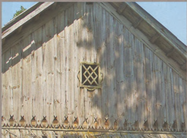
Рисунок 25 — Фронтон жилого дома в Подберезье Вилейского р-на

В интерьере жилого помещения, чаще на балке, реже на стенах вырезали дату строительства или какое-либо пожелание. В храмах такие надписи размещали ниже, на ушаках и притолоках дверей. Здесь надпи-