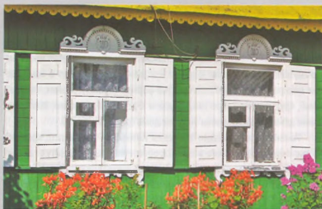
Рисунок 15 — Окна жилого дома в Добринево Дзержинского р-на