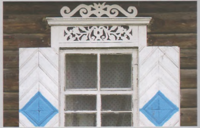
Рисунок 13 — Окно жилого дома в Заборье Россонского р-на

Особой темой в искусстве создания внешнего декоративного убранства здания стала обшивка досками фронтонов («щитов») двускатных крыш. Доски укладывали таким образом, что их вертикальное, горизонтальное и наклонное положения помогали составить красивые, хотя и достаточно простые узоры в виде сочетания различных геометрических фигур: треугольников, квадратов, прямоугольников (рисунок 24). Популярной была укладка досок «в елочку». Эти декоративные приемы использовались в сооружениях самого различного назначения — от жилых домов до храмов. В Полесье, особенно в его западной части и в центре, обшивка фронтонов получила наиболее широкое распространение. В дополнение к геометрическим сюжетам в декоративном убранстве