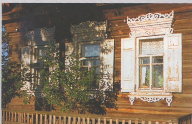
Рисунок 18 — Окна жилого дома в Ветке