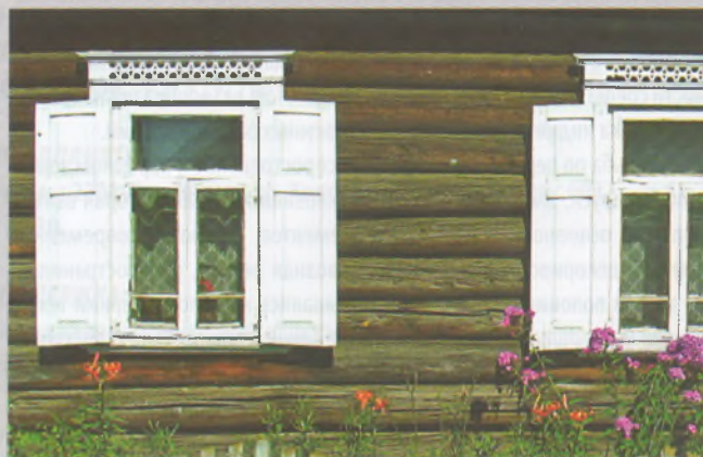
Рисунок 10 — Окна жилого дома в Бытче Борисовского р-на