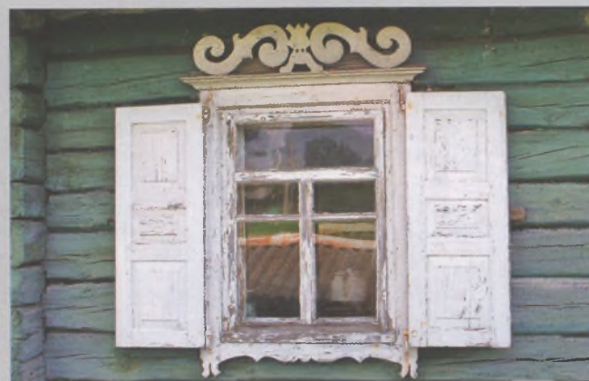
Рисунок 8 — Окна жилого дома в Островлянах Мядельского р-на