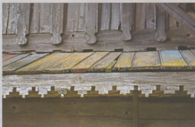
Рисунок 4 — Карниз жилого дома в Ольшевцах Вилейского р-на