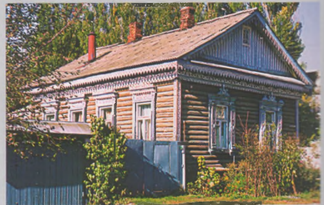
Рисунок 19 — Жилой дом Гомеле