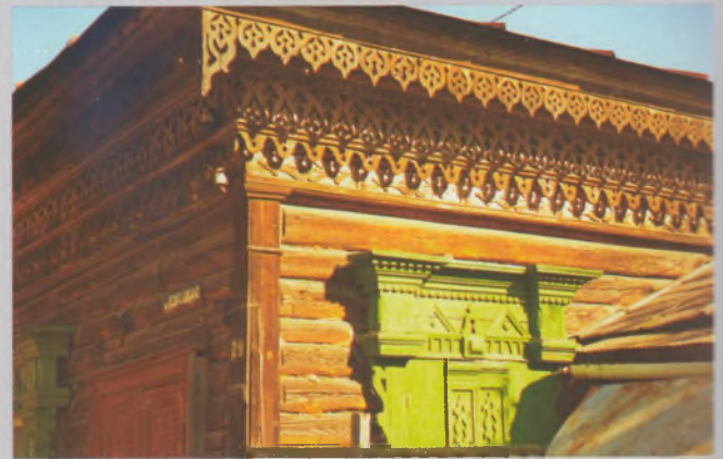
Рисунок 16 — Карниз жилого дома в Гомеле