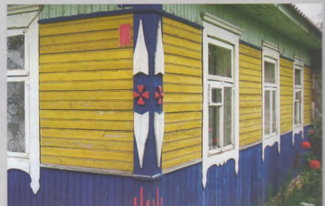
Рисунок 22 — Угол жилого дома в Горностаилово Копыльского р-на