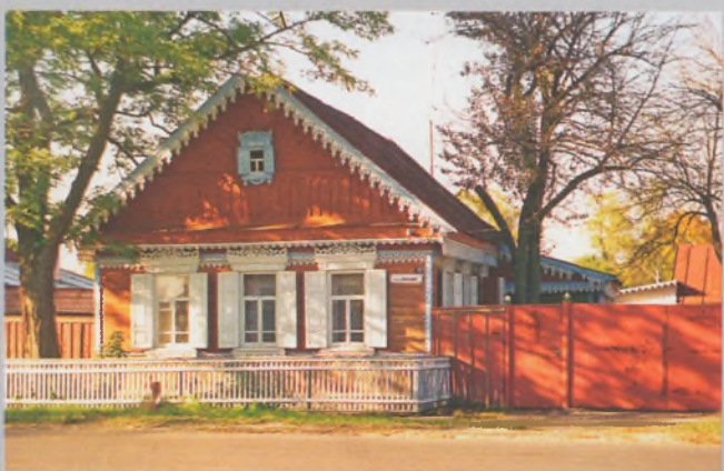
Рисунок 20 — Жилой дом в Ветке