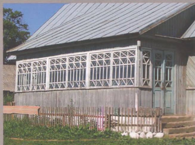
Рисунок 31 — Веранда жилого дома в Драгулевцах Ошмянского р-на