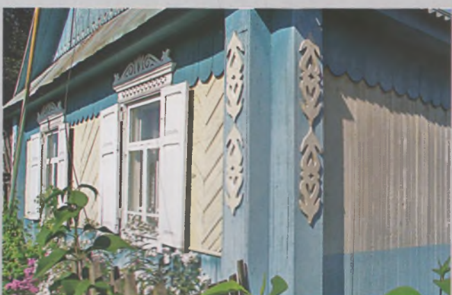
Рисунок 21 — Угол жилого дома в Хросте Борисовского р-на