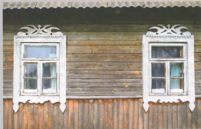
Рисунок 3 — Окна жилого дома в Акановичах Кореличского р-на