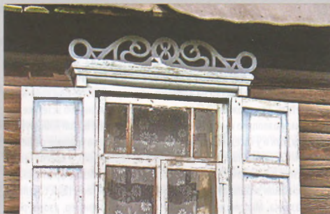
Рисунок 7 — Окно жилого дома в Будагово Смоленвичского р-на