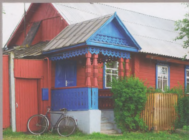
Рисунок 27 — Крыльцо жилого дома в Шклове

Например, на Восточном Полесье бревнам, которые выступают в углах, придавали форму шестигранников. Когда, жилой дом рубили из «дылей» — бревен, распиленных вдоль пополам, то выступающие концы делали пятигранными. Такие решения создавали контраст между выразительными гранями выступов углов и округлой формой бревен самих стен, а также обогащали светотеневые эффекты. Своеобразно рубились угловые соединения в народном строительстве юго-западных районов Брестчины — угол «в каню». Торцы застенных выступов делались с подрезкой, ступеньками. Благодаря этому сам застенный выступ получался не цельным, а разреженным, с весьма активным силуэтным решением.