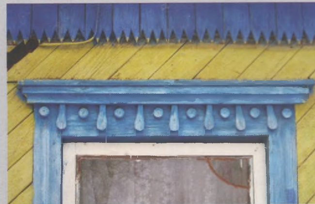
Рисунок 11 — Декор окна жилого дома в Деменке Петриковского р-на