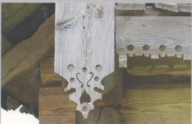
Рисунок 23 — Карниз жилого дома в Болтогузах Мядельского р-на