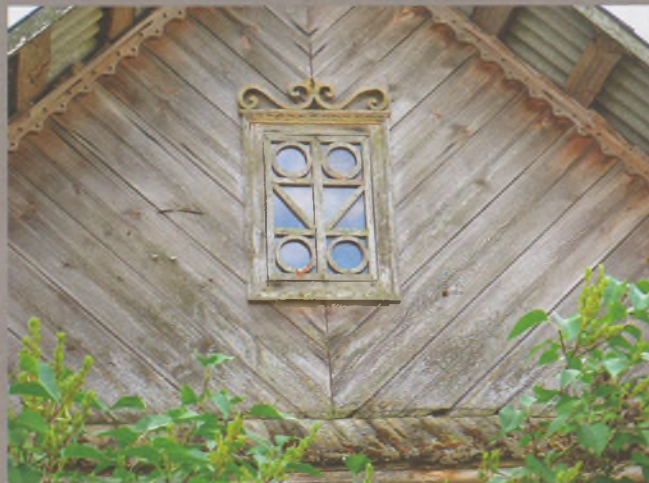
Рисунок 26 — Фронтон жилого дома в Болтогузах Мядельского р-на