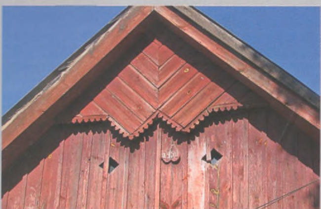
Рисунок 24 — Декор фронтона жилого дома в Залесье Кобринского р-на