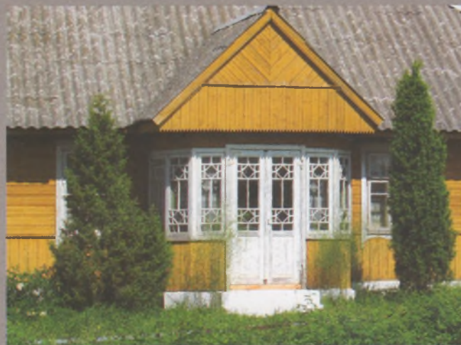
Рисунок 30 — Веранда жилого дома в Гервях Островецкого р-на