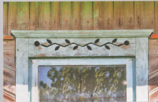
Рисунок 9 — Наличник окна жилого дома в Виржах Докшицкого р-на