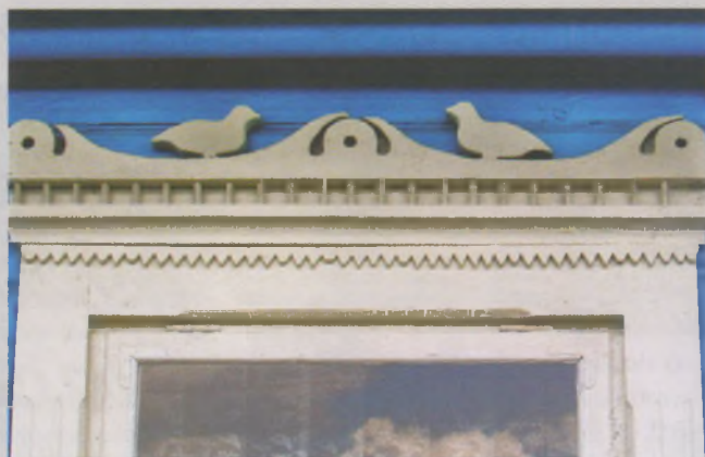
Рисунок 1 — Карниз наличника окна жилого дома в Слониме