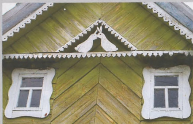
Рисунок 2 — Фронтон жилого дома в Бродах Пружанского р-на