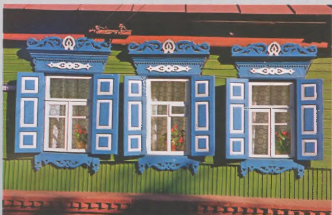
Рисунок 17 — Окна жилого дома в Гомеле