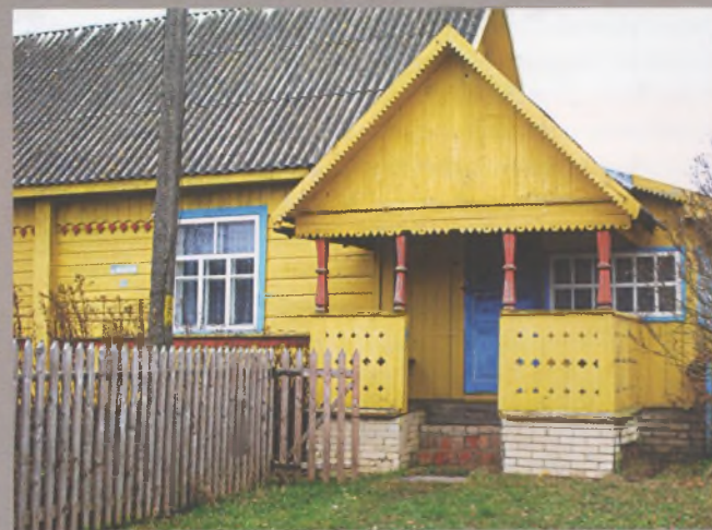
Рисунок 28 — Крыльцо жилого дома в Нивищах Горецкого р-на