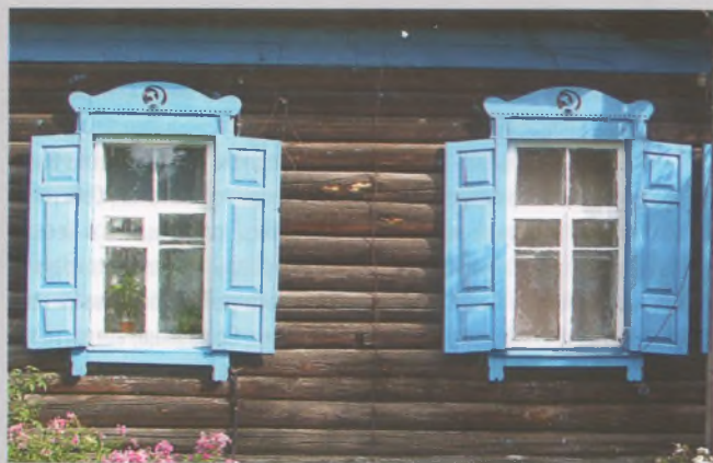
Рисунок 14 — Окна жилого дома в Глуше Бобруйского р-на