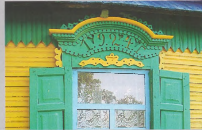
Рисунок 12 — Окно жилого дома в Слободе Богушовской Бобруйского р-на