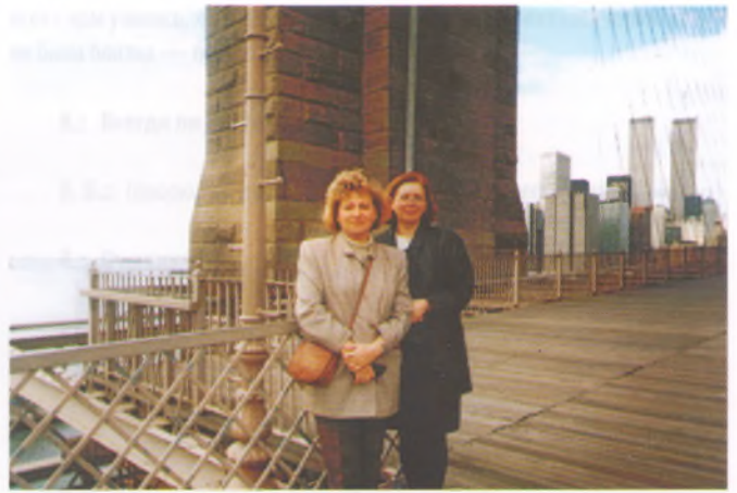
США '2002 г.