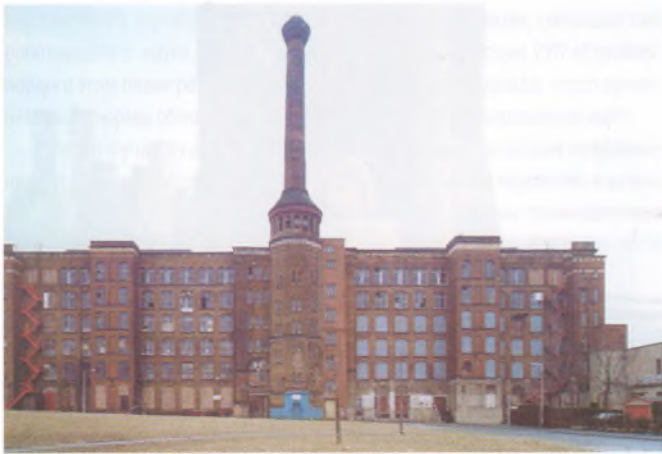
Памятники промышленной архитектуры Англии и Германии

одинаковые семена, почву, освещение, приемы агротехники. Лично я отношусь именно к таким невезучим натуралистам-ботаникам. Какое-то есть биополе у человека, которое может способствовать росту растений или наоборот. Тем не менее думаю, что материальная основа этого явления со временем станет известной и понятной, но будут существовать необъясненными еще многие другие такие же загадочные явления.