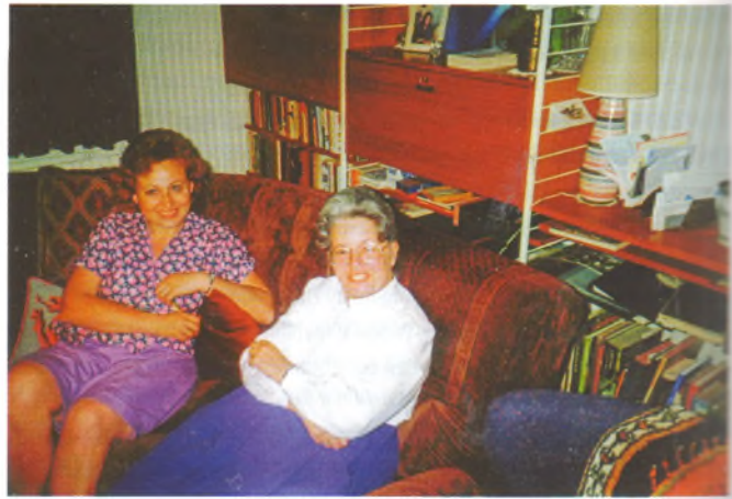
Высшая архитектурная школа в Оксфорде. Англия '1993 г.

Е. Б.: Не задумывалась о том, люблю ли путешествовать. Поездила много и продолжаю это делать, была и неоднократно во многих городах Европы и даже США, но это все не путешествия, а разные научные поездки: конференции, конкурсы, семинары, научные стажировки. Видеть новые места, встречать новых людей и общаться с ними; узнавать новое всегда интересно, но можно ли это назвать путешествиями, не знаю.