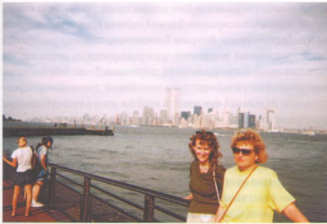
США '1998 г.