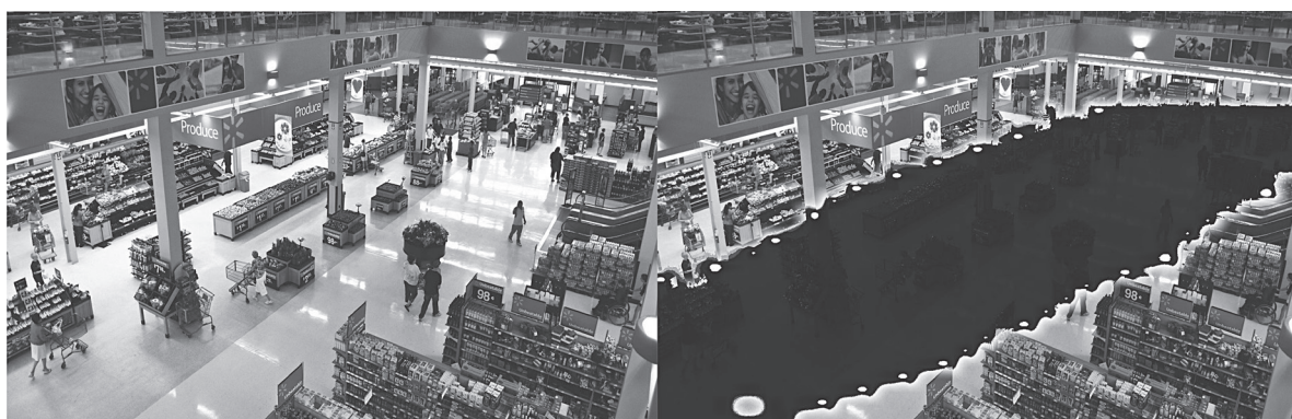
Рис. 2. Представление траекторий посетителей торгового центра