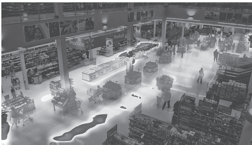
Рис. 4. Тепловая карта движения посетителей торгового зала