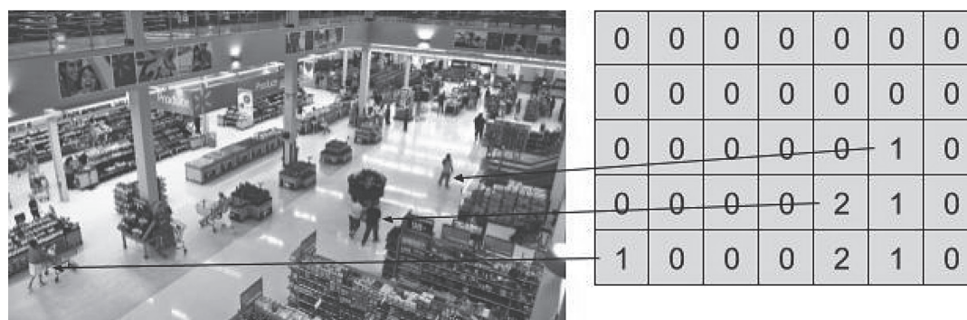
Рис. 3. Связь объектов на сцене со счетчиками зон