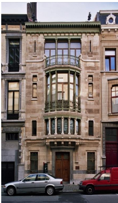
Рис. 1 – Отель Тассель

В конце 19-ого века начал зарождаться новое направление в архитектуре и искусстве – модерн, который поспособствовал возрождению старых стилей, таких как, например, готика, со своими новыми, неповторимыми деталями [1]. Его первым представителем стал бельгийский архитектор Виктор Орта со своим проектом «отель Тассель» (1893-1894), (рис. 1).