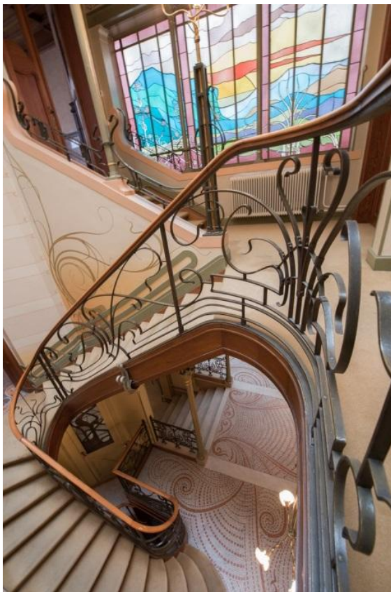
Рис. 3 – Центральная лестница

Данное здание предназначалось для богатых людей и сполна воплощало в себе новый стиль того времени. Самой яркой особенностью дома является роскошный декор: балюстрады и колонны (рис. 2) имеют извилистую форму, а растительные элементы украшают стены и полы. Эта красота, однако, больше, чем просто отделка. Орта был смел в использовании материалов, таких как железо, и умело использовал их в проекте, как, например, оформление центральной лестницы (Рис. 3).