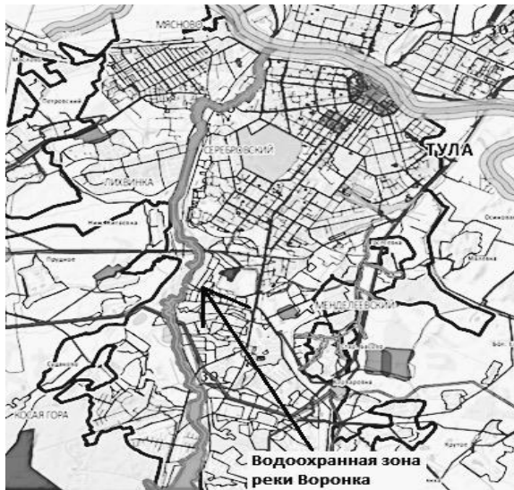
Рис. 2 – Водоохранная зона реки Воронка