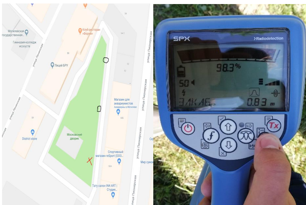
Рисунок 2 – расположение территории исследования с отметками фонарных столбов на ней. X – точка отправления, первый столб. □ – Второй столб на пути, не подключенный к сети. 0 - третий столб. Средняя глубина залегания кабелей является 0.83 метра

Про исследования на местности: прибором были проведены исследования внутреннего двора учебного корпуса Белорусско-Российского университета № 6, строительного факультета. В результате исследования были найдены электрические кабеля фонарных столбов и ТВ кабель. Результаты работы будут показаны для первого искомого объекта.