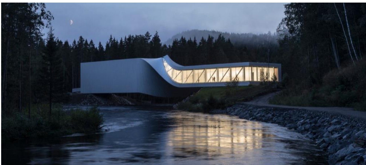
Рисунок 3 – разделение моста на две части: северная и южная

По словам руководителя BIG, мост имеет по середине изгиб 90 градусов, что и разделяет мост на две части(рис 3). А эти же части имеют и разные размеры. Двухуровневую южную часть, которая не имеет окон, называю «интровертной», а стеклянную северную часть, заканчивающаяся террасой, – «экстравертной». Ну и поэтому разделяются и выставочные комнаты: южная предназначена для картин, а северная – для скульптур и инсталляций.