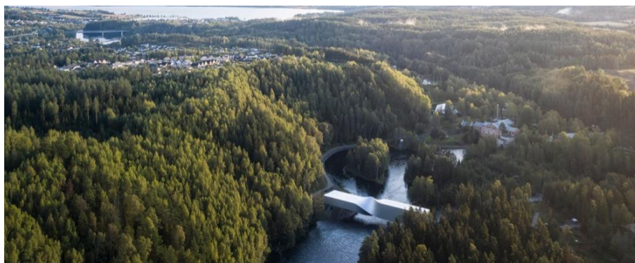
Рисунок 2 – мост-музей с высоты птичьего полета