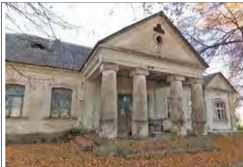
Рисунок 3. Красная звезда: усадьба «Радзивиллимонты»

Важным элементом архитектурной композиции дома является четырехколонный портик дорического ордера, искусно выполненный в дереве. Большую роль в его художественном выражении играет цвет. Колонны, их базы и капители, архитрав, триглифы, розетки, портики окрашены в белый цвет; тимпан фронтона, метопы и промежутки между модильонами по фронтому — темно-красного цвета, при определенном освещении — пурпурного.