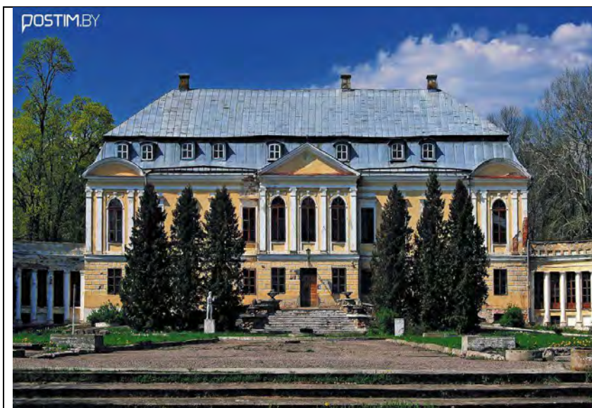
Рисунок 5. Дворец в Святске

Дворцово-парковый комплекс Святск построен в XVIII в. итальянским архитектором Д. Сакко для известного графского и дворянского рода Воловичей. Вокруг дворца был разбит английский парк, посажены сад, лес из грабов, сосен, кленов, устроены пруды, оранжерея и пасека (Рис. 5).