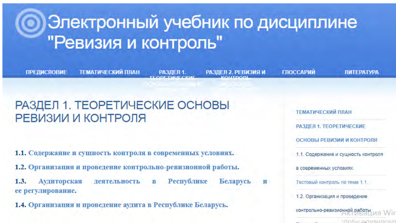
Рисунок 2 – Структура электронного учебника

• в блоке «Вспомогательный раздел» размещены материалы по организации самостоятельной работы, методические материалы по курсовому проектированию, перечень тем рефератов по учебной дисциплине, требования по оформлению рефератов по дисциплине, перечень литературы с указанием нормативно-правовых и инструктивных положений Республики Беларусь. Их использование позволяет углубить и закрепить теоретические знания и практические навыки, получаемые на аудиторных занятиях. У учащихся формируются навыки самостоятельной работы с использованием современных компьютерных технологий.