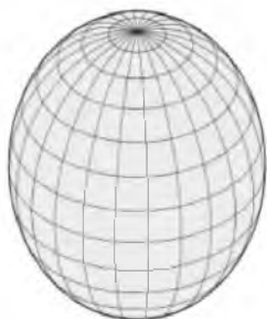
Рис. 1. Вытянутый эллипсоид вращения

Величины a, b, c называют полуосями эллипсоида. Поверхность вращения в трехмерном пространстве, образованная при вращении эллипса вокруг одной из его главных осей называют эллипсоидом вращения. Разделяют вытянутый эллипсоид вращения (рис. 1).