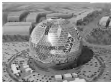
Рис. 8. Проект многофункционального комплекса в Дубай

Таким образом, преподавание математики распадается на две составляющие: на чисто формальное изучение математического объекта и на визуальные образы-ощущения [3].