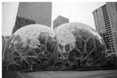
Рис. 6 Сферы в Amazon в Сизтле, 2018 г.

В качестве примеров сферических сооружений можно назвать объекты (рис. 6; рис. 7; рис. 8).