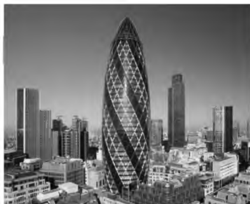
Рис. 5. Офисное здание «Мэри-Экс» в Лондоне, 2004 г.

Широко используется в архитектуре и частный случай эллипсоида — сфера с каноническим уравнением