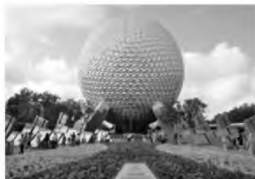
Рис. 7. Развлекательный центр Spaceship Earth в Диснейленде во Флориде, 1982 г.