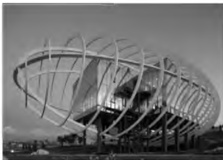
Рис. 4. Многофункциональное здание для компании Tema Istanbul в Турции, 2015 г.