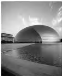
Рис. 3. Национальный центр исполнительских искусств в Пекине, 2007 г.

Примеров использования эллипсоида в мировой архитектурной практике достаточно много (рис. 3; рис. 4; рис. 5).