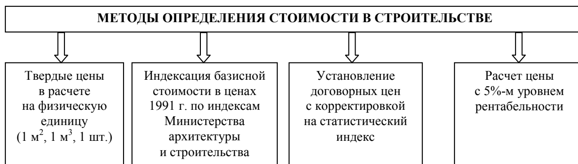
Рис. 1. Методы определения стоимости в строительстве

• при определении текущей стоимости домов (квартир) в сельскохозяйственных организациях расчеты должны производиться с обеспечением рентабельности работ на уровне, не превышающем 5 % стоимости.