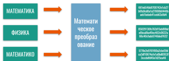
Рисунок 1. Пример работы хеш-функции

Хеширование — это процесс, преобразовывающий входные данные произвольной длины в битовую строку определенной длины, при этом выходная хеш-функция заполняется различными символами.