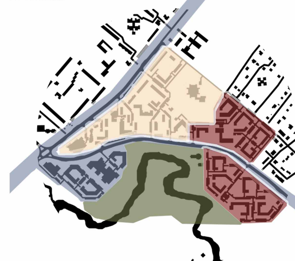
СХЕМА ОЧЕРЕДНОСТИ СТРОИТЕЛЬСТВА М 1:10000

Первая очередь Вторая очередь Третья очередь Четвертая очередь