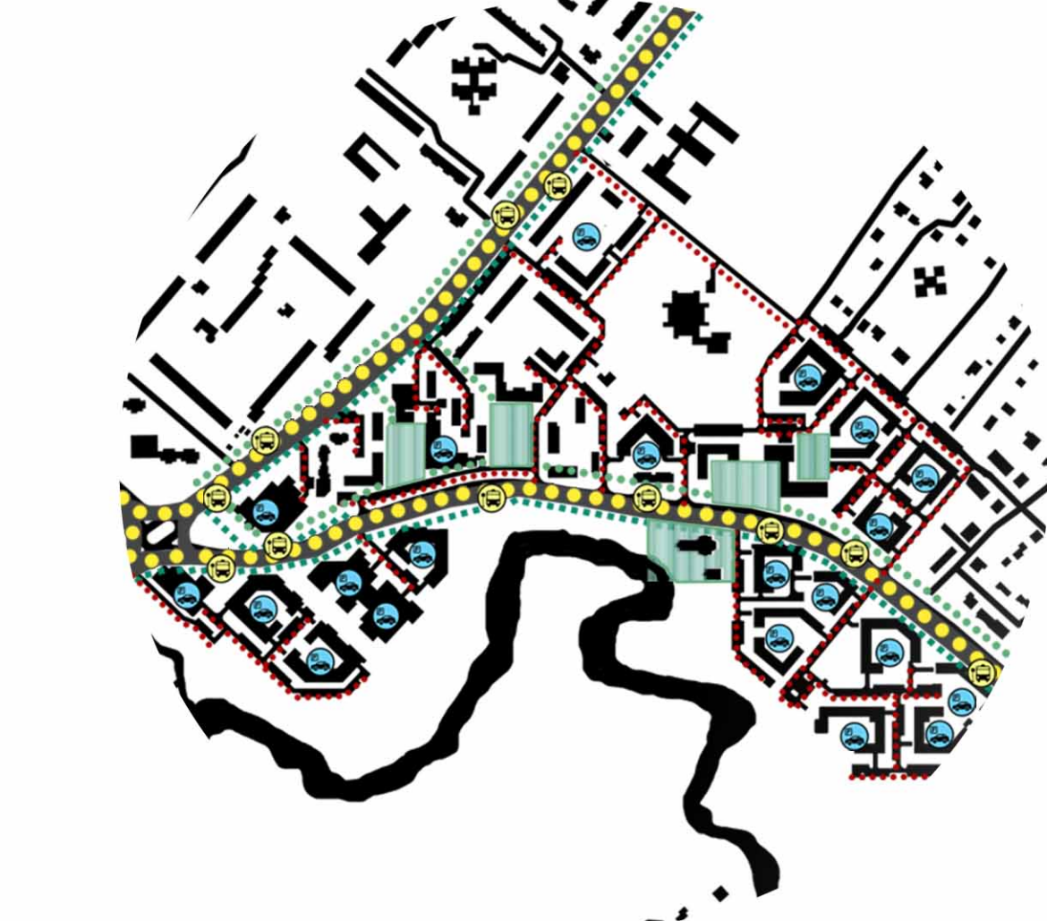
СХЕМА ТРАНСПОРТНО-ПЕШЕХОДНЫХ СВЯЗЕЙ М 1:10000

Рытневое общественное пространство Остатки общественного транспорта Паркинг-наземная парковка/аэропорт Пути движения общественного транспорта Велодрожжка Основные пешеходные пути