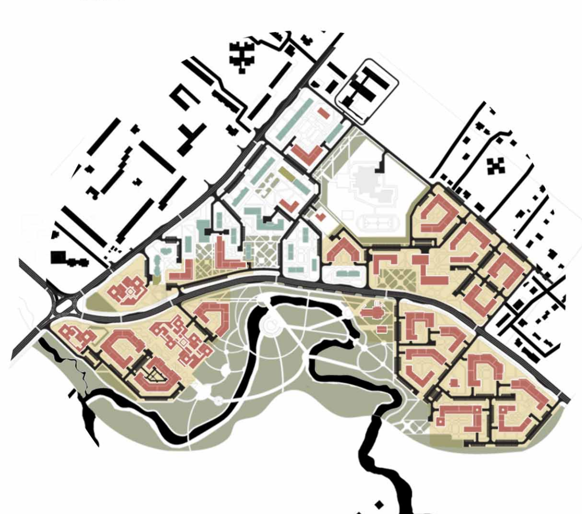
СХЕМА РЕКОНСТРУКТИВНЫХ МЕРОПРИЯТИЙ М 1:10000

Новое строительство Застройка подпадающая сносу Реконструируемые объекты