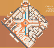
СХЕМА ПЕШЕХОДНОГО ДВИЖЕНИЯ ПОСЕЛКА

ТЕМА: ПРЕОБРАЗОВАНИЕ И РАЗВИТИЕ ГОРОДА ЗАВАРЕХ