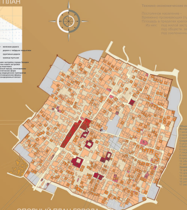
ОПОРНЫЙ ПЛАН ГОРОДА М 1:1000