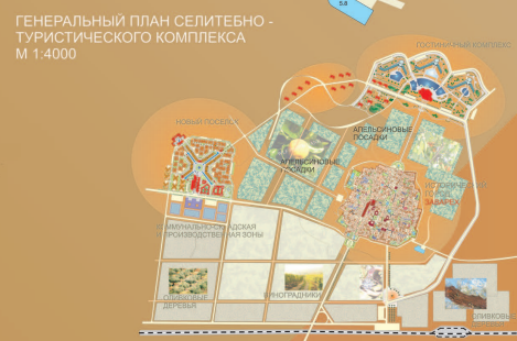
ГЕНЕРАЛЬНЫЙ ПЛАН СЕЛИТЕБНО-ТУРИСТИЧЕСКОГО КОМПЛЕКСА М 1:4000