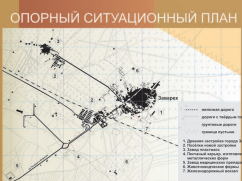
ОПОРНЫЙ СИТУАЦИОННЫЙ ПЛАН