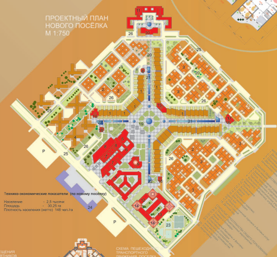
Технико-экономические показатели (по новому поселку) Население - 2,5 тысячи Плотность населения (мг/га) 148 чел/га