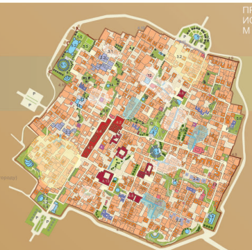
ПРОЕКТНЫЙ ПЛАН ИСТОРИЧЕСКОГО ГОРОДА М 1:1000