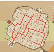
ПРОЕКТНЫЙ ПЛАН НОВОГО ПОСЕЛКА М 1:750