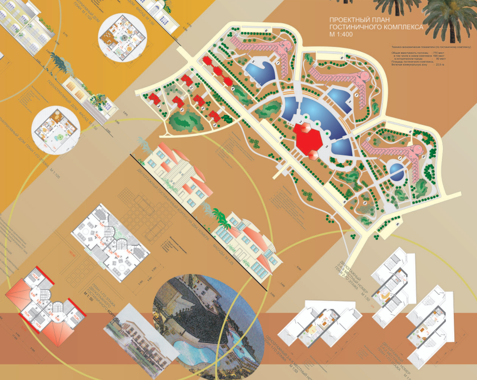
ПРОЕКТНЫЙ ПЛАН ГОСТИНИЧНОГО КОМПЛЕКСА М 1:400