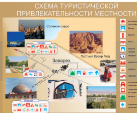
СХЕМА ТУРИСТИЧЕСКОЙ ПРИВЛЕКАТЕЛЬНОСТИ МЕСТНОСТИ