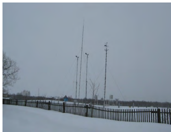
Рисунок 1.2-Площадка метеостанции №1