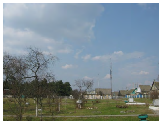
Рисунок 11.2-Площадка метеостанции №13