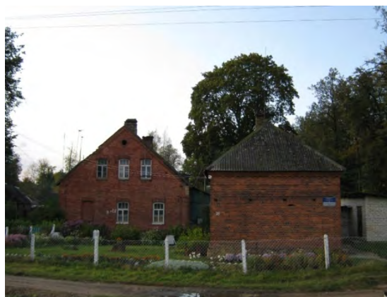
Рисунок 6.1-Административное здание метеостанции №6

Глубина залегания грунтовых вод 4-6 м (определена по колодцу).