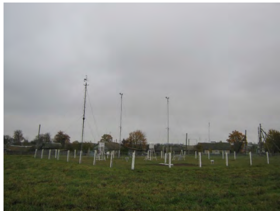
Рисунок 7.2-Площадка метеостанции №7