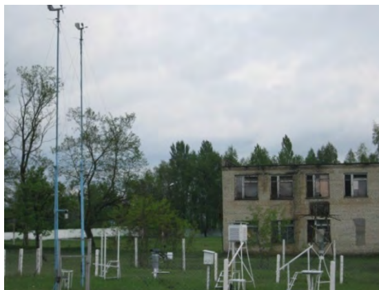
Рисунок 39.2- Площадка метеостанции №49