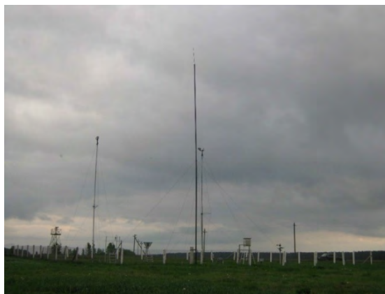
Рисунок 35.2- Площадка метеостанции №43