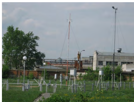
Рисунок 36.2- Площадка метеостанции №44