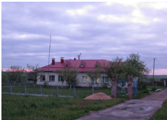
Рисунок 22.1- Административное здание метеостанции №29

Почвенный разрез на месте установки термометров имеет следующий вид: 0-30 см – супесь, 30-130 см – белый бесструктурный песок. Глубина залегания грунтовых вод 1 м.