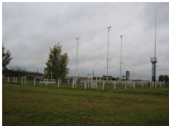
Рисунок 15.2-Площадка метеостанции №18