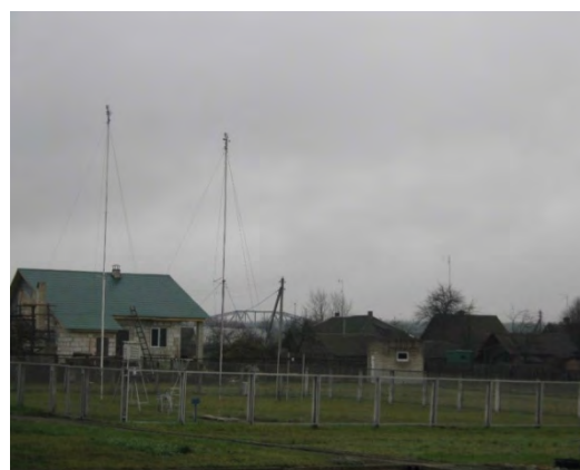
Рисунок 14.2-Площадка метеостанции №17