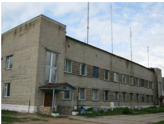
Рисунок 39.1- Административное здание метеостанции №49

Высота метеоплощадки после переноса 189 м над уровнем моря (до переноса-162 м). Подстилающая поверхность площадки – травяной покров. Почвы в районе станции и на окружающей местности дерново-подзолистые, глинистые и суглинистые.