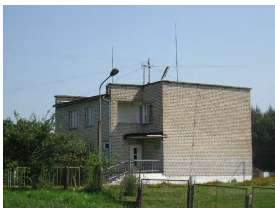
Рисунок 18.1-Административное здание метеостанции №22

С июля 1981 года метеорологическая площадка расположена в северо-восточной части г. Лида в 1 км к ССВ от прежнего местоположения. Ближайшие строения (в два этажа) находятся в 100 м к СЗ, в 150 м к ССВ, в 400 м к ЗЮЗ и в 500 м к ЗСЗ. В 200 м к В – полоса хвойного леса. В 500 м к З проходит шоссе, за ним – городские постройки. В 80 м к В с С на Ю в период с 1986 по 1990 год проложена подъездная дорога к котельной строящегося завода. Почва на площадке супесчаная. Глубина залегания грунтовых вод 8-9 м (определена по ближайшему колодцу).