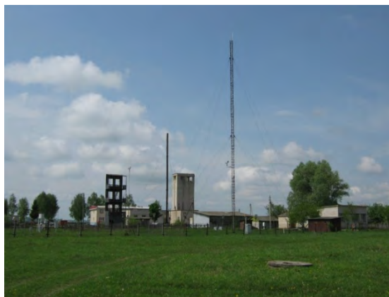
Рисунок 41.2- Площадка метеостанции №51