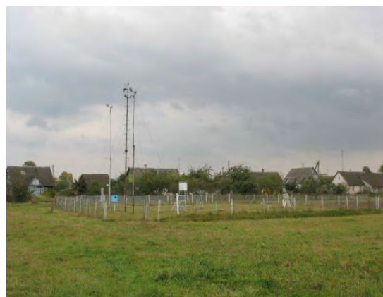
Рисунок 6.2-Площадка метеостанции №6