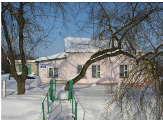
Рисунок 3.1-Административное здание метеостанции №3

Глубина залегания грунтовых вод около 2 м.