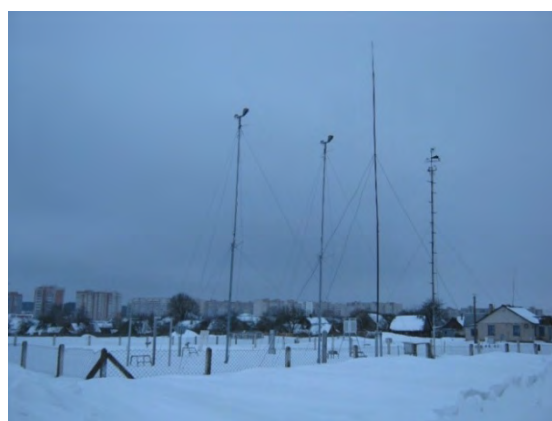
Рисунок 10.2-Площадка метеостанции №10