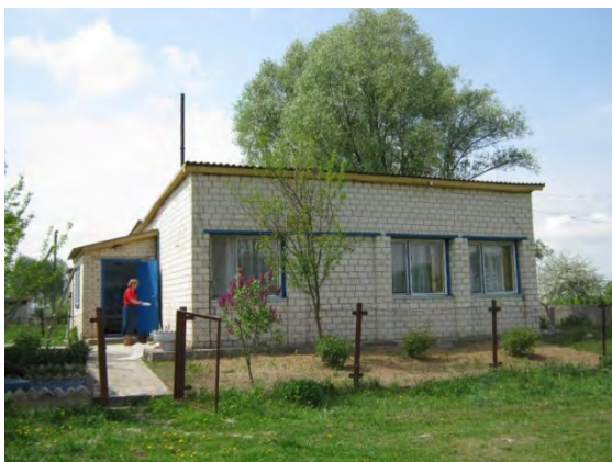
Рисунок 41.1- Административное здание метеостанции №51

Грунт на метеоплощадке (песчаная и супесчаная смесь) насыпной в связи со снятием слоя почвы после аварии на Чернобыльской АЭС. Толщина насыпного слоя 15-20 см. Глубина залегания грунтовых вод 3-3,5 м.