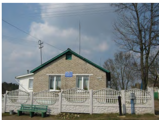
Рисунок 11.1-Административное здание метеостанции №13

Метеоплощадка на станции Борисов не переносилась с 1961 года, но за истекший период произошли существенные изменения в ее ближайшем окружении. В 1 км к ЮВ в 1975 году начато и к 1980 году закончено строительство завода авиационных приборов. Возле завода возведен ряд пятиэтажных жилых домов. В 1986 году в 70-80 м к В построено двухэтажное здание Борисовского лесхоза высотой 11 м. Располагавшийся в 80 м к СЗ от метеоплощадки лес частично вырублен. Метеоплощадка сильно защищена.