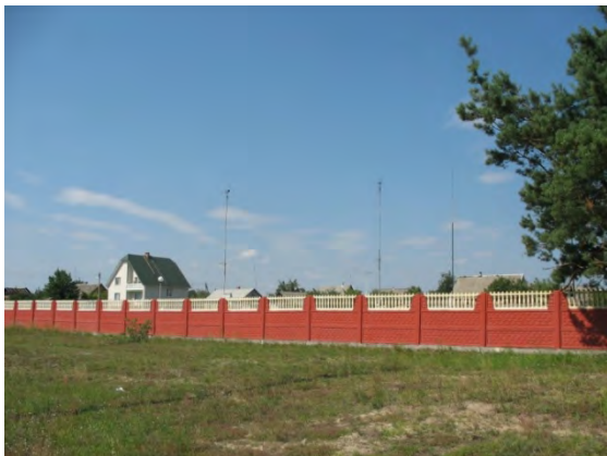
Рисунок 40.1- Административное здание метеостанции №50

К 1996 году в 300 м к ЮВ от метеоплощадки закончено строительство двух многоэтажных жилых домов.