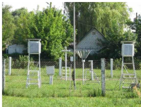
Рисунок33.2- Площадка метеостанции №48