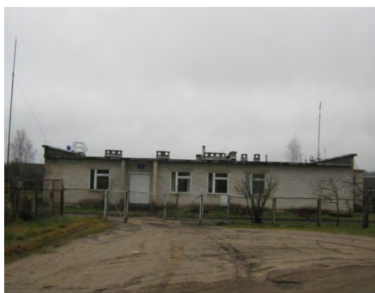
Рисунок 14.1-Административное здание метеостанции №17