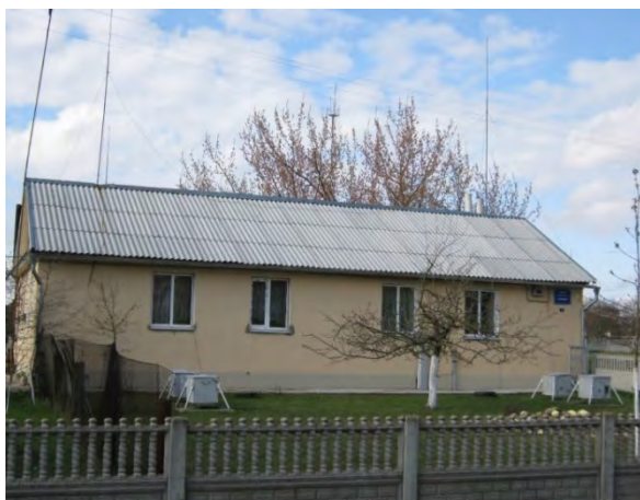
Рисунок 16.1-Административное здание метеостанции №19

Почва на метеоплощадке и окружающей местности супесчаная. Глубина залегания грунтовых вод 18-20 м.