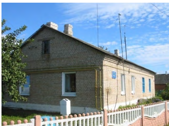
Рисунок 12.1-Административное здание метеостанции №15

В ноябре 1968 года на расстоянии 50 м к СЗ построен хлебозавод общей площадью 250 м 2 и высотой 8 м, в мае 1969 года в 50 м к ЮЗ от метеоплощадки – одноэтажный жилой дом, а в июле 1972 года в 100 м к С – засолочный цех площадью 200 м 2 и высотой 8 м. В ноябре 1986 года в 20 м к В закончено строительство одноэтажного здания магазина.