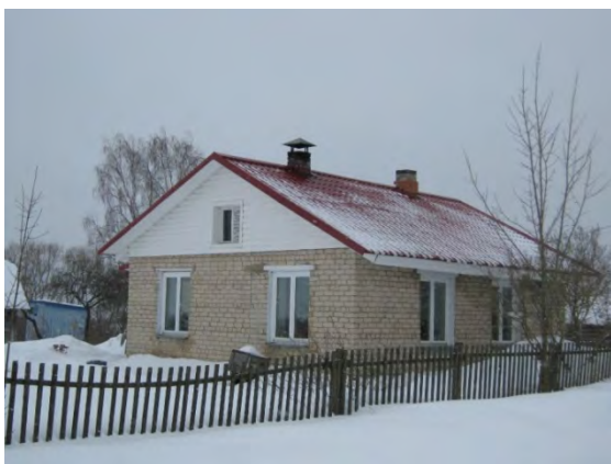
Рисунок 1.1-Административное здание метеостанции №1