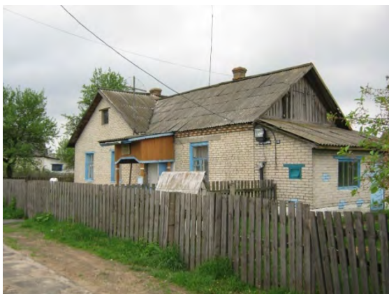
Рисунок 35.1- Административное здание метеостанции №43

Почвенный покров на метеоплощадке имеет следующий разрез: 0-30 см – супесь; 30-55 см – белый мелкозернистый песок; 55-150 см – красная глина. Глубина залегания грунтовых вод 8-9 м.