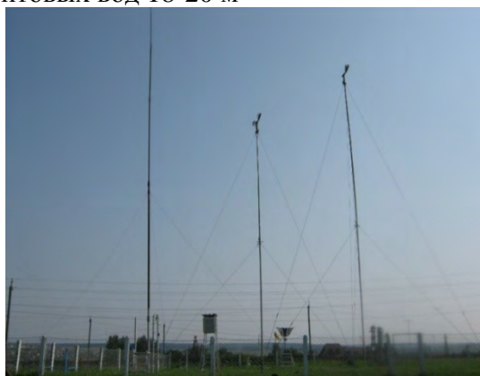
Рисунок 19.1- Площадка метеостанции №24

Почва на площадке суглинистая, как и на окружающей местности. Глубина залегания грунтовых вод 18-20 м