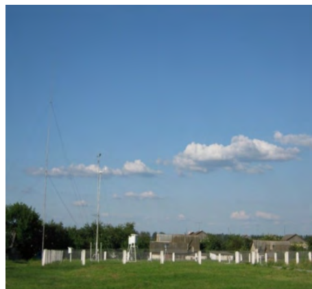
Рисунок 28.2- Площадка метеостанции №35