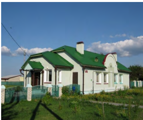
Рисунок 28.1- Административное здание метеостанции №35

Лесистость территории 46%. Под болотами 7.8%. В границах района находятся заказники республиканского значения: гидрологический Выгонощанское, биологический Споровский, Барановичский. Памятниками природы объявлены Турнянские черные березы, парк "Грудополь", Чистая Дубрава.