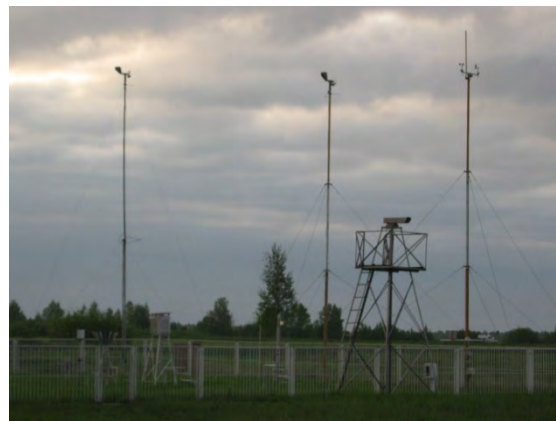
Рисунок 25.2- Площадка метеостанции №32