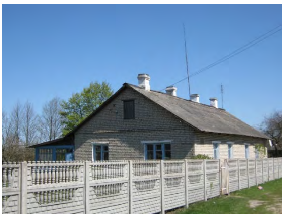
Рисунок 38.1- Административное здание метеостанции №46

В 1996 году в 30-40 м к З от метеорологической площадки построены частные гаражи. На показания приборов на метеорологической площадке они влияния не оказывают.