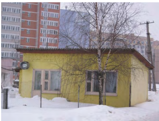
Рисунок 5.1-Административное здание метеостанции №5

31 мая 1989 года метеоплощадка перенесена на 5-6 км к СВ от прежнего местоположения, на северо-восточную окраину г. Витебска. Местность холмистая, овражистая. В 4 км к З от метеоплощадки протекает р. Зап. Двина, в 600 м к С – приток Зап. Двины – р. Витьба. Ближайшие строения расположены: в 22 м к Ю – служебное помещение метеогруппы и гараж высотой до 3 м, в 70 м к ЮЗ – трехэтажное здание «Белторгодежда», в 60 м к ЗЮЗ и 30 м к З – одноэтажные здания мастерских, в 25 м к С – одноэтажный жилой дом и надворные постройки, с СВ и В – открытая местность. Ближайший лес расположен в 2,5-3 км к ВСВ (лесной массив небольшой, значительно вырубленный). Почвы песчаные и супесчаные. На метеоплощадке грунт насыпной. Высота метеоплощадки после переноса 174 м над уровнем моря (до переноса – 166 м).