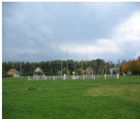
Рисунок 4.2-Площадка метеостанции №4