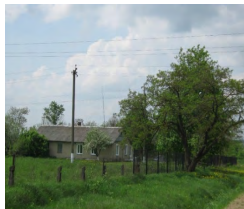
Рисунок 24.2- Площадка метеостанции №31