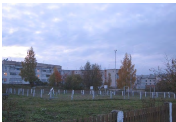
Рисунок 9.2-Площадка метеостанции №9