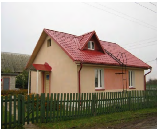
Рисунок 8.1-Административное здание метеостанции №8

Поверхность площадки покрыта луговой растительностью, почва – супесчаная. Глубина залегания грунтовых вод около 2 м.