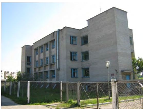
Рисунок 31.1- Административное здание метеостанции №40

Поверхность площадки покрыта травой. Состав почвы: 0-35 см – супесь; 35-320 см – песок. Уровень грунтовых вод на глубине более 3 м.