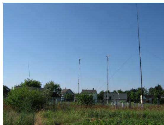
Рисунок 31.2- Площадка метеостанции №40