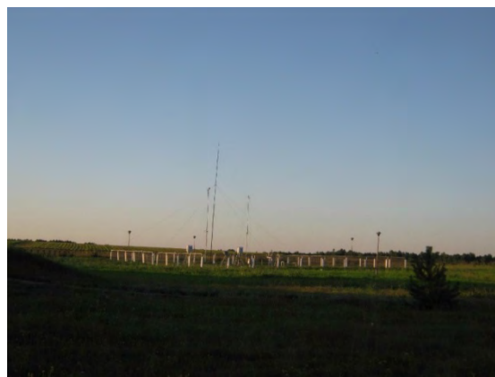
Рисунок 29.2- Площадка метеостанции №36