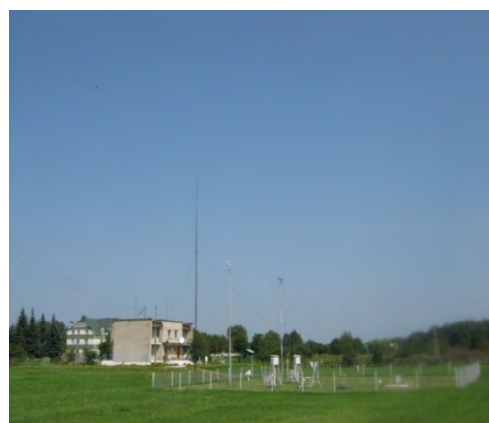
Рисунок 18.2-Площадка метеостанции №22