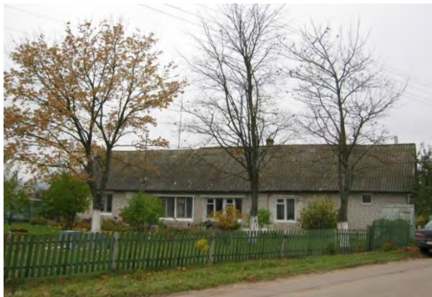
Рисунок 7.1-Административное здание метеостанции №7

Почва – супесчаная. Почвенный разрез на метеоплощадке имеет следующий вид: 0-25 см – супесчаный пахотный слой с примесью камней; 25-50 см – желтый мелкий песок; далее – слой глины красного цвета. Глубина залегания грунтовых вод примерно 7 м (определена по колодцам).