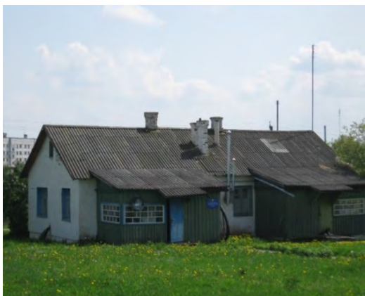
Рисунок 23.1- Административное здание метеостанции №30

В 80 м к В от метеоплощадки с С на Ю проходит улица, застроенная в 1981-1983 годах одноэтажными жилыми домами высотой до 6 м. В 1984 году в 150 м к С построены два кирпичных одноэтажных дома. Последние расположены в пониженной части рельефа и на показания метеоприборов влияния не оказывают. Почва на метеоплощадке характеризуется следующим разрезом: 0-30 см – суглинок, 30-70 см – красная глина с включением мелкого гравия и песка, 70-320 см – красная глина. Глубина залегания грунтовых вод примерно 10 м.