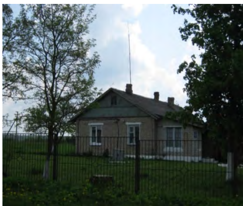
Рисунок 24.1- Административное здание метеостанции №31

Ближайшие строения (служебное здание и хозяйственные постройки метеостанции) расположены в 60 м к З, за метеостанцией – фруктовые деревья высотой до 5 м. В 150 м к З с С на Ю проходит одноколейная железная дорога, за которой в 200 м от метеоплощадки в пониженной части рельефа находятся одноэтажные строения г. Костюковичи. Вдоль полотна железной дороги тянется лесопосадка высотой 5-8 м. Почва на метеоплощадке характеризуется следующим разрезом: 0-8 см – пахотный гумусовый слой; 8-22 см – серый, в нижней части темный, песок; 22-48 см – желтый с бурыми затеками песок; 48-110 см – пятнистый светло-желтый песок.