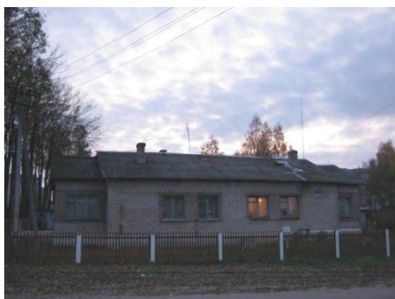
Рисунок 9.1-Административное здание метеостанции №9

В 35 м к ЮВ расположено помещение метеостанции, в 100 м к Ю – полоса деревьев, за которой – группа двух и трехэтажных панельных домов с плоской крышей. В ноябре 1981 года в 60 м к С от метеоплощадки друг за другом построены 2 одноэтажных дома. Оба дома находятся в пониженной части рельефа и на показания приборов влияния не оказывают. Особенно интенсивное строительство вблизи площадки развернулось в 1986-1987 годах: в 200-300 м к ЮЮЗ и З построены трехэтажные дома высотой до 9 м; в 100-250 м к ЮЗ – ряд трех- и пятиэтажных жилых домов высотой до 9-14 м; в 50-70 м к ЮЗ и З на насыпном грунте общей высотой 10-10,5 м возведены двух и трехэтажные дома высотой до 9 м. Почва в районе метеостанции дерново-подзолистая. Почвенный слой до 20 см, на глубине 20-40 см – песок, глубже 40 см – глина с песком. Глубина залегания грунтовых вод 5 м.