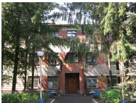
Рисунок 36.1- Административное здание метеостанции №44

Состав почвы характеризуется таким же разрезом, как и на предыдущей площадке. Глубина залегания грунтовых вод более 3 метров.