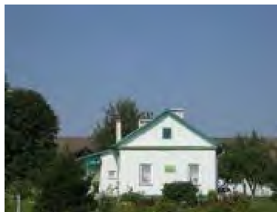
Рисунок 20.2- Административное здание метеостанции №25