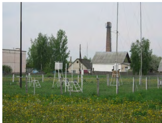
Рисунок 34.2- Площадка метеостанции №41