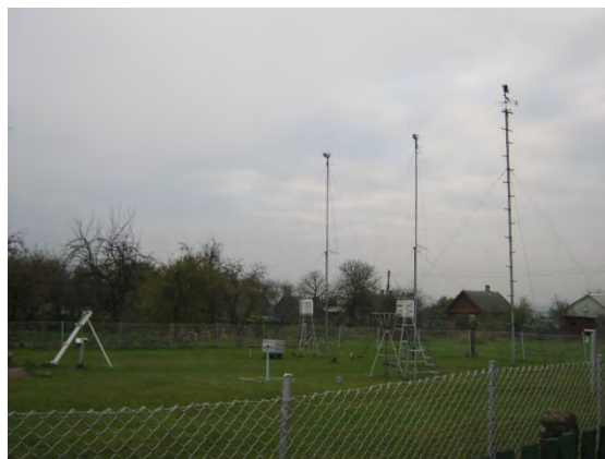
Рисунок 8.2-Площадка метеостанции №8