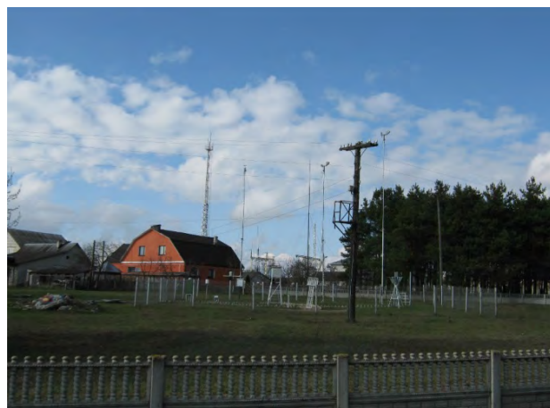
Рисунок 16.2-Площадка метеостанции №19