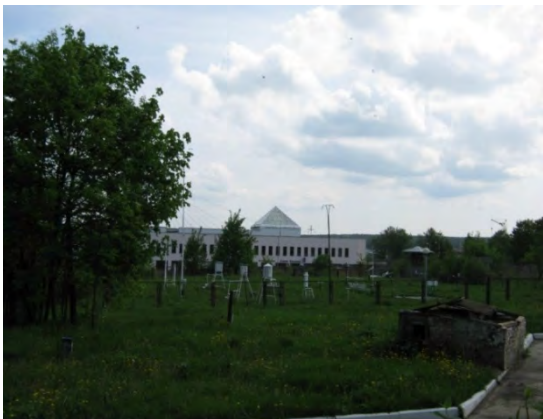
Рисунок 13.1-Площадка метеостанции №16

Глубина залегания грунтовых вод более 3 метров.