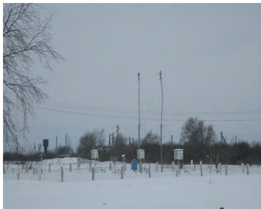
Рисунок 2.2-Площадка метеостанции №2