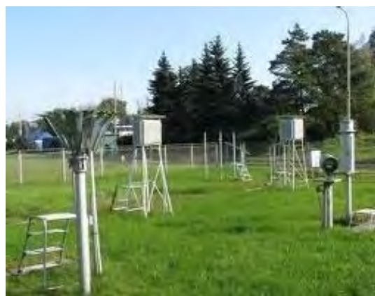
Рисунок 32.2- Площадка метеостанции №47