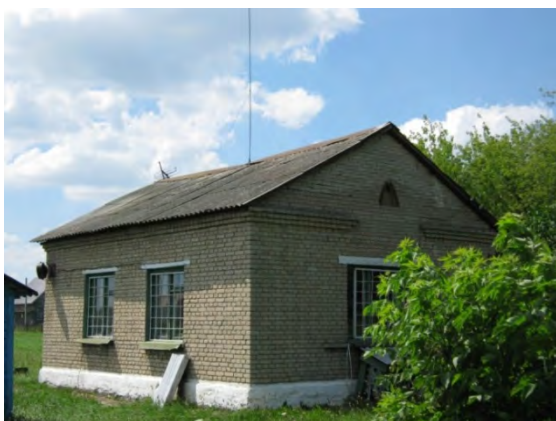
Рисунок 26.1- Административное здание метеостанции №33

С 1962 года метеоплощадка не меняла своего местонахождения, но в ее ближайшем окружении произошли некоторые изменения. В 1968 году в 700 м к З построено 7 одноэтажных домов и 2 двухэтажных. К 1991 году в 50 м к В возведено одноэтажное здание завода «Эталон» и на расстоянии 120-150 м к В – ряд одноэтажных жилых домов. В 1992 году начато и к 1999 году закончено строительство двух трехэтажных домов в 330-450 м к Ю и ЮЗ от метеоплощадки, а в 600-750 м к СВ завершено строительство жилого массива из многоэтажных домов (в 6-9 этажей).