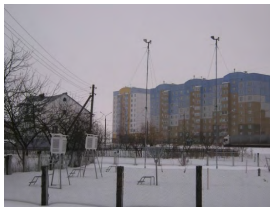
Рисунок 5.2-Площадка метеостанции №5