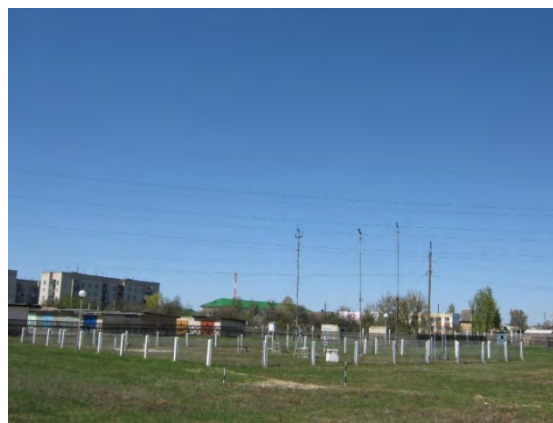
Рисунок 38.2- Площадка метеостанции №46