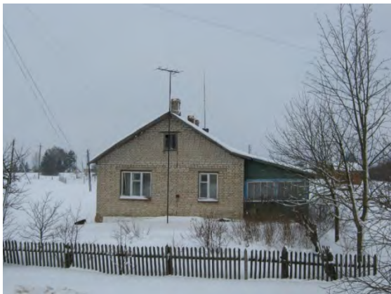
Рисунок 2.1-Административное здание метеостанции №2