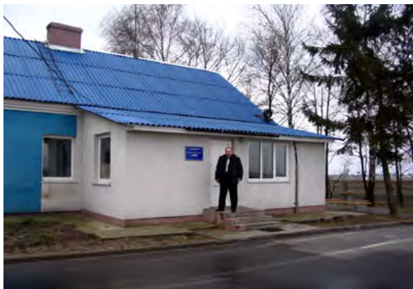
Рисунок 17.1-Административное здание метеостанции №20

Почва на площадке и окружающей местности супесчаная. Глубина залегания грунтовых вод 3,3 м (определена по скважине у метеоплощадки).