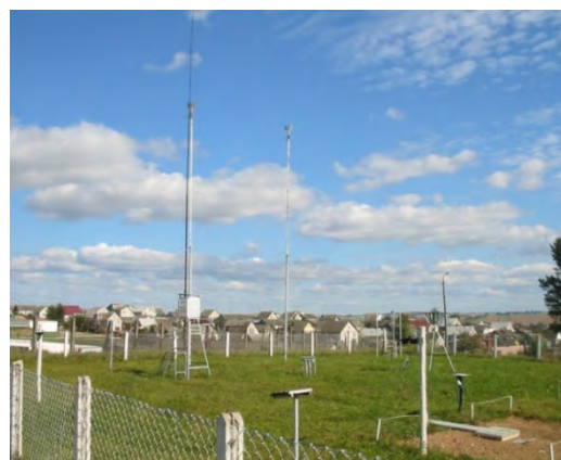
Рисунок 12.2-Площадка метеостанции №15