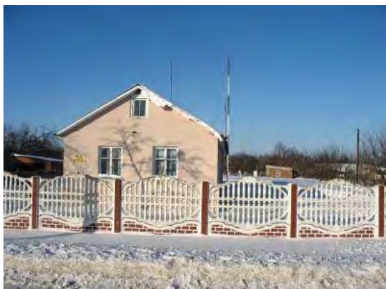
Рисунок 37.1- Административное здание метеостанции №45

Высота метеоплощадки над уровнем моря после переноса не изменилась – 139 м. Почва на площадке имеет следующий разрез: 0-50 см – супесь, 50-70 см – светло-желтый песок, 70-240 см – глина, 240-320 см – глей. Глубина залегания грунтовых вод около 5 м.