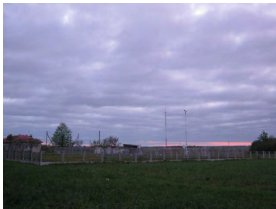
Рисунок 22.2- Площадка метеостанции №29