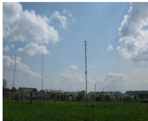
Рисунок 23.2- Площадка метеостанции №30