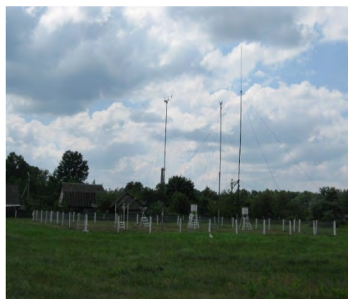
Рисунок 27.2- Площадка метеостанции №34