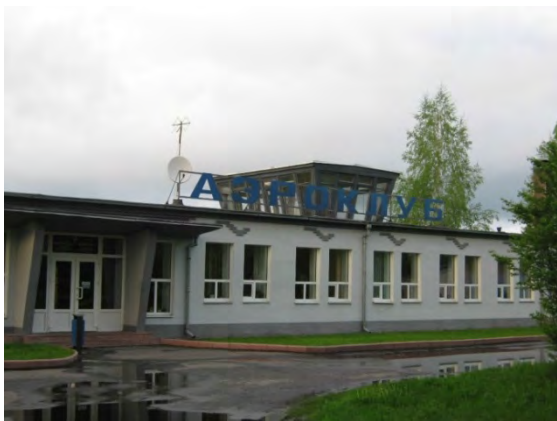
Рисунок 25.1- Административное здание метеостанции №32

Почвенный разрез на метеоплощадке имеет следующий вид: 0-35 см – супесь; 35-70 см – песок; 70-90 см – суглинок. Глубина залегания грунтовых вод 0,2-1,0 м.