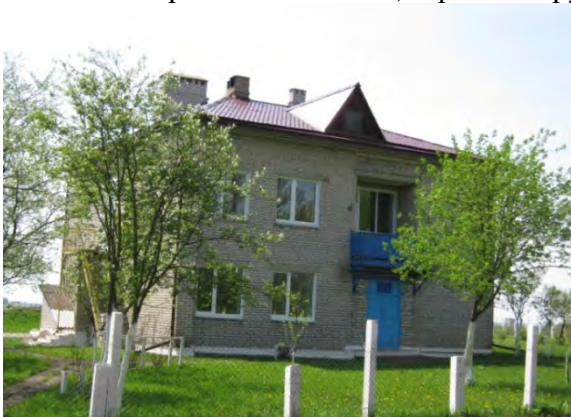
Рисунок 21.1- Административное здание метеостанции №27

Ближайшие леса расположены к ЮЗ и ЗЮЗ: (в 2,4 км – лиственная роща с примесью хвойных пород, в 4 км – еловый лес и в 10 км – смешанный лес). В ноябре 1989 года в 150 м к СЗ от метеорологической площадки проложена высоковольтная ЛЭП, четыре опоры которой находятся в охранной зоне станции. Почвы в районе станции и ее окрестностей дерново-подзолистые, суглинистые. Почвенный разрез имеет следующий вид: 0-20 см – мягкий суглинок, 20-40 см – средний суглинок, 41-70 см – мягкий суглинок серого цвета, 71-100 см – тяжелый суглинок желтого цвета, 101-140 см – средний суглинок, 141-360 см – лесовидный суглинок (глубже 200 м с прослойками глея) Уровень грунтовых вод в районе станции примерно 18 м.