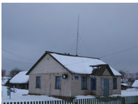
Рисунок 10.1-Административное здание метеостанции №10

Почвы в районе метеостанции суглинистые. Уровень залегания грунтовых вод 15-20 м.