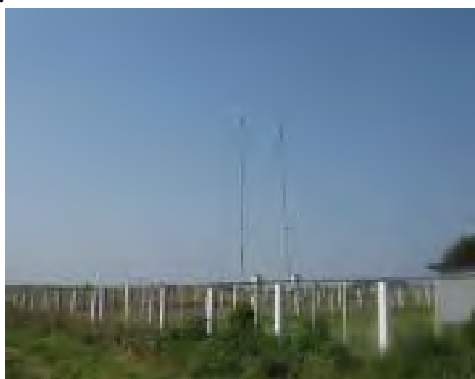
Рисунок 20.1- Площадка метеостанции №25

Глубина залегания грунтовых вод около 5 м (определена по скважине, расположенной в 300 м к югу). С 7 мая 1970 года до 16 мая 1972 года высота метеоплощадки во всех документах ошибочно считалась 281 м (во время нивелировки превышение ошибочно взято с обратным знаком). В 1972 году высота метеоплощадки уточнена (ватерпасовкой) и равна 278 м над уровнем моря.