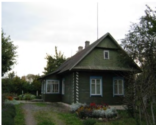
Рисунок 4.1-Административное здание метеостанции №4

Почва в районе станции суглинистая. Почвенный разрез на метеоплощадке имеет следующий вид: 0-50 см – суглинок, 50-130 см – темно-желтая глина, глубже 130 см – более светлая глина с включением гравия. Глубина залегания грунтовых вод 8-13 м.