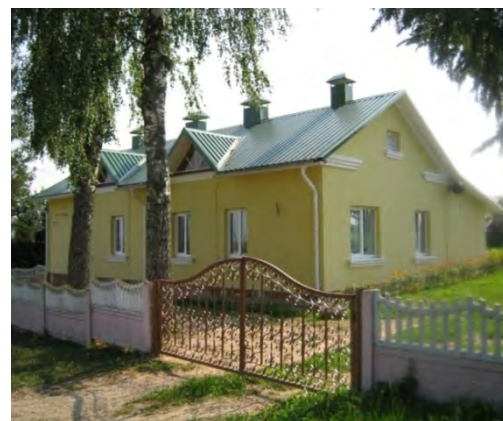
Рисунок 19.2- Административное здание метеостанции №24