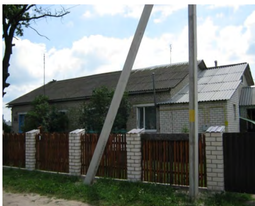
Рисунок 27.1- Административное здание метеостанции №34

мелкозернистый песок; 140-320 см – плывущий слой серого намывного песка с небольшой примесью серой глины. Глубина залегания грунтовых вод около 1,5 м.