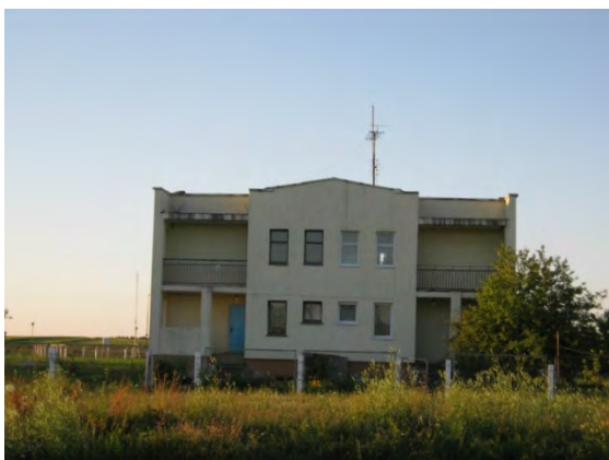
Рисунок 29.1- Административное здание метеостанции №36

Высота метеоплощадки 162 м над уровнем моря. Глубина залегания грунтовых вод 1,7 м.