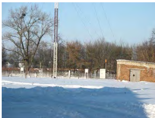
Рисунок 37.2- Площадка метеостанции №45