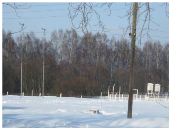
Рисунок 3.2-Площадка метеостанции №3