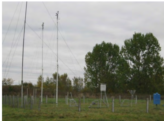
Рисунок 17.2-Площадка метеостанции №20