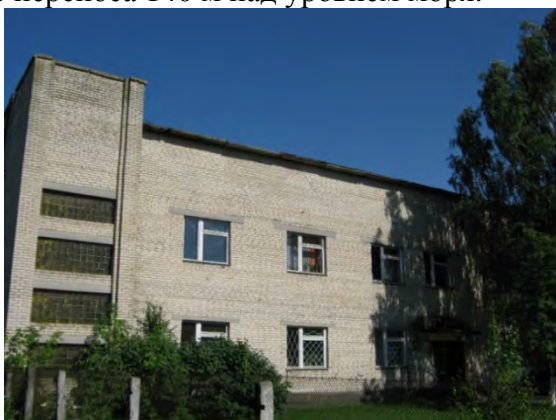
Рисунок 33.1- Административное здание метеостанции №48

1 января 1984 года метеостанция и метеоплощадка перенесены на 6,5 км к ЮЗ от аэропорта. В ближайшем окружении метеоплощадки находятся: в 75 м к СВ – двухэтажное здание ГС (высота 10 м), в 70 м к ЮВ – гараж высотой 5 м, в 50 м к С – трансформаторная подстанция. В 200 м к ЮЗ от метеоплощадки расположен элеватор, в 150 м к СЗ – химкомбинат, в 50 м к Ю – кооперативные гаражи. Почва супесчаная. Высота метеоплощадки после переноса 140 м над уровнем моря.