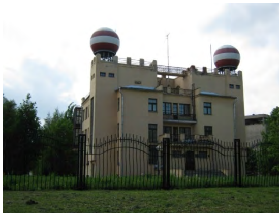
Рисунок 13.2-Административное здание метеостанции №16