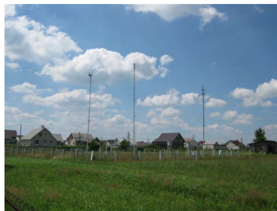
Рисунок 26.2- Площадка метеостанции №33