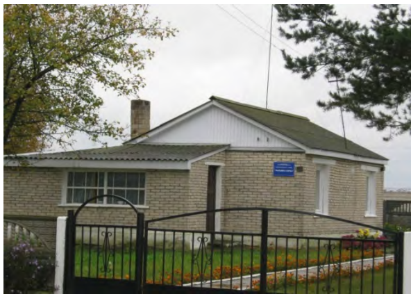
Рисунок 15.1-Административное здание метеостанции №18

Грунтовые воды залегают на большой глубине, 5-6 м.