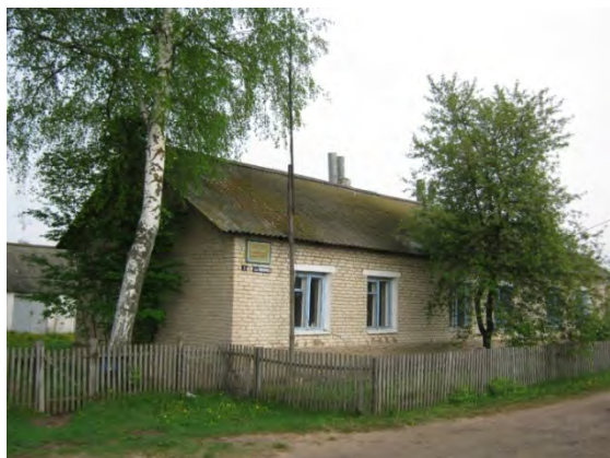
Рисунок 34.1- Административное здание метеостанции №41

Почвы в районе преимущественно супесчаные. Почвенный разрез на метеоплощадке имеет следующий вид: 0-40 см – супесь; 40-300 см – мелкоструктурный желтый песок; 300-320 см – тощая глина. Глубина залегания грунтовых вод более 3 м.