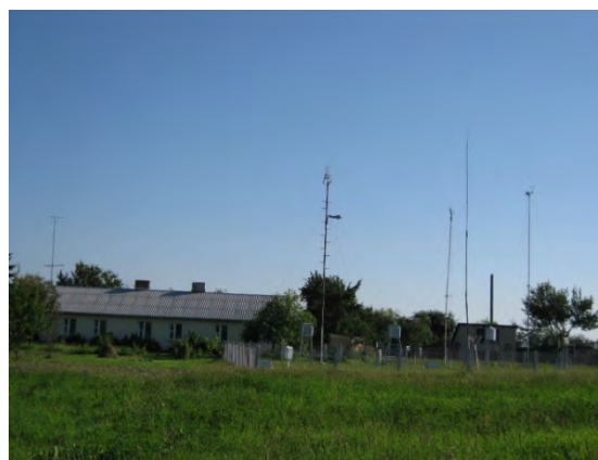
Рисунок 30.2- Площадка метеостанции №37