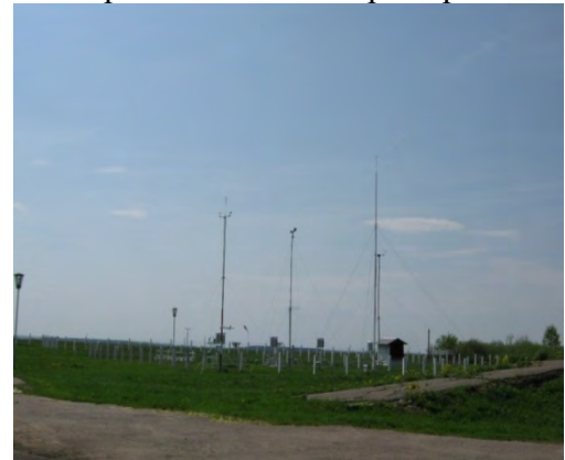
Рисунок 21.2- Площадка метеостанции №27