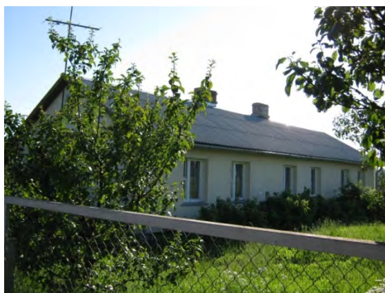
Рисунок 30.1- Административное здание метеостанции №37

Местоположение метеоплощадки не менялось, но в ближайшем ее окружении произошли некоторые изменения. В 1972 году в 50 м к С от метеоплощадки построено новое здание метеостанции. В 1981 году на расстоянии 250 м к ЮВ построен одноэтажный жилой дом и в 350 м к В закончено строительство кирпичного двухэтажного здания детского комбината. Влияния на показания приборов эти строения не оказывают. К 1989 году деревья, окружающие метеоплощадку, достигли высоты 6-7 м, изменив закрытость горизонта. В период 1995-2000 год произведена частичная вырубка деревьев. В период 1994-1997 годы построены: в 45 м к В от метеоплощадки – сарай, в 180 м к ЮВ одноэтажный жилой дом, площадью 100 м 2 , в 200 м к ЮВ – 3-х этажное здание поликлиники, площадью 200 м 2 .