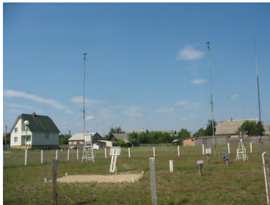
Рисунок 40.2- Площадка метеостанции №50