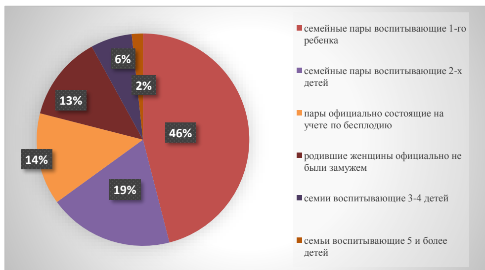
Диаграмма 2. – Статистические данные о семьях в РБ

В Республике Беларусь по официальной статистике чуть более 14 процентов супружеских пар не могут иметь детей, данный негативный показатель растет с каждым годом. На сегодняшний день льготные кредиты выдает ОАО "АСБ Беларусбанк" в белорусских рублях сроком до 5 лет с уплатой процентов за пользование ими в размере 50% ставки рефинансирования Национального банка. Максимальная сумма кредита – до 300 базовых величин, установленных на дату заключения кредитного договора.