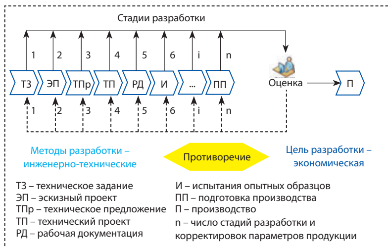
Рисунок 3. Порядок разработки продукции