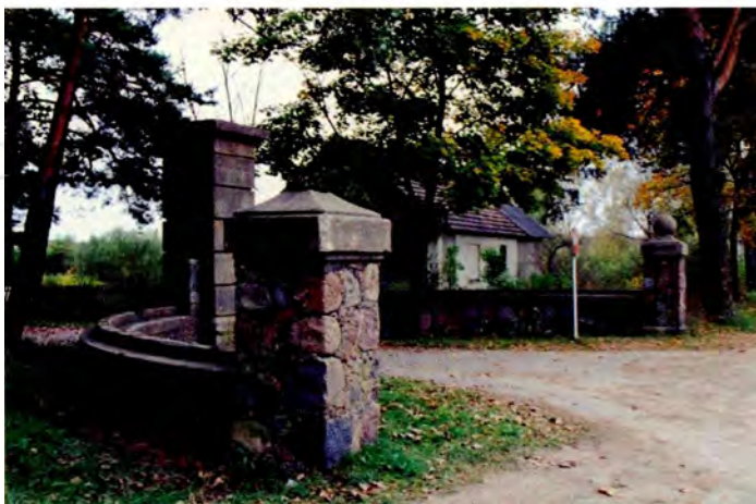
Мал. 3. Брама пры ўваходзе ў парк. в. Варапаева (Пастаўскі р-н). Пач. XX ст.