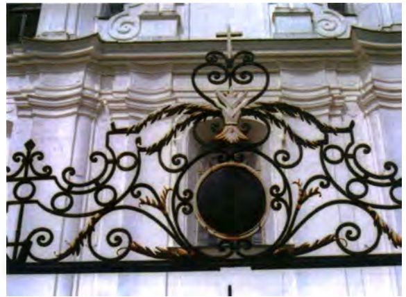
Мал. 9. Дэталь брамы касцёла ў Дунілавічах (Пастаўскі р-н)

маў у матэрыяльна-камунікацыйнай і візуальна-камунікацыйнай звязцы з асноўным будынкам палаца, храма ці сядзібы. Падыходы да брамы і яе пазіцыя адносна галоўнага будынка часта спецыяльна спланіраваны, каб адкрыць архітэктурнаму адрасу, як толькі мы праходзім праз яе. Што ж датычыцца стылістычнай і кампазіцыйнай сувязі з агароджай, то яна магла існаваць і не існаваць. У некаторых выпадках брама стваралася наогул як самастойная пабудова, падкрэсліваючы сваё кампазіцыйнае прызначэнне (мал. 1, 2).