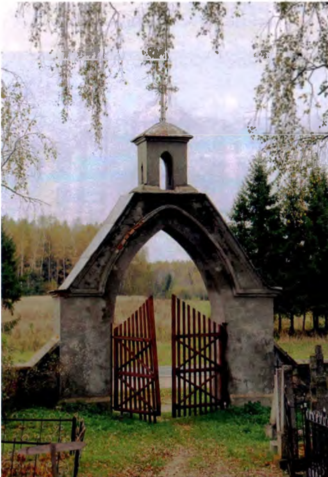
Мал. 11. Могілкавая брама ля в. Чарняты (Мядзельскі р-н). Пач. XX ст.

сімвалічнага прызначэння брамы. Бакавыя акцэнтны ствараюць агульны вобраз «вартавых» уваходу. Таму слупы вельмі выразна руставаліся, на іх «насаджваліся» шары ці шпілі (мал. 4, 5). Нярэдка прыклады выкарыстання скульптурных выяў ільвоў, якія таксама «ахоўвалі» ўваходы. Сімуляцыя абароны прыводзіла да таго, што брамы вырашаліся ў выглядзе псеўдазамкавых вежаў-пілонаў. Гэта адначасова адпавядала ідэям рамантызму ў архітэктуры паркаў, дзе знаходзіліся сядзібныя дамы (мал. 6).