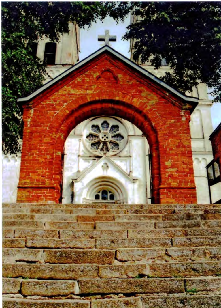
Мал. 15. Брама пры ўваходзе ў касцёл у Слабодцы (Браслаўскі р-н). Пач. XX ст.

Чароўна выглядаюць невялікія ліхтарыкі (бельведэрчыкі) над брамамі перад вясковымі храмамі ці могілкамі. Гэты тып сялянскіх брамаў асабліва цікавы, таму што тут ствараліся сапраўдныя творы мастацтва. Іх архітэктура іншы раз абсалютна індывідуальная і своеасаблівая. Архітэктурная форма пры гэтым не адпавядае строга таму ці іншаму архітэктурнаму канону, яна імправізічная і кожны раз непаўторная, што гаворыць пра таленавітасць мясцовых майстроў (мал. 13–15).