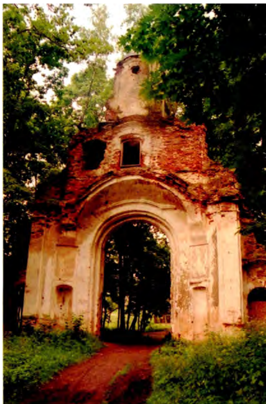
Мал. 2. Брама перад сядзібай у Сітцах (Докшыцкі р-н). XVIII ст.