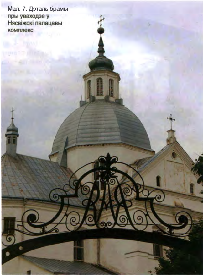
Мал. 7. Дэталь брамы пры ўваходзе ў Нясвіжскі палацавы комплекс