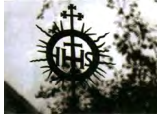
Мал. 8. Дэталь могілкавай брамы ў Ракаве