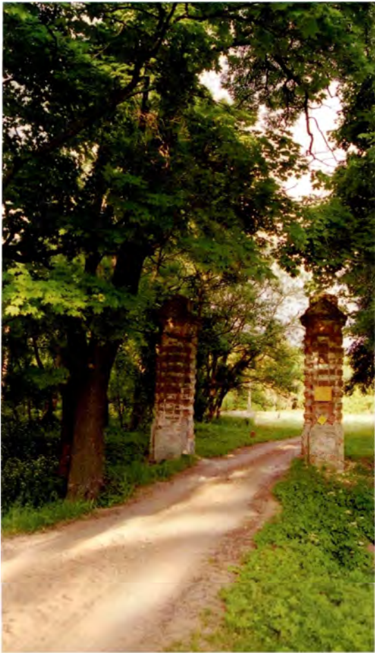
Мал. 4. Брама пры уваходзе у сядзібны парк. в. Дубаі. (Пінскі р-н). XIX ст.

Функцыянальнае выкарыстанне брамаў не лакалізуецца з тым ці іншым іх тыпалагічным відам. Яно можа быць змешаным: некаторыя гарадскія брамы мелі як функцыю аховы (нават каравульныя памяшканні), так і сакральную (капліца у браме, выявы святога), напрыклад Вострая брама у Вільні.