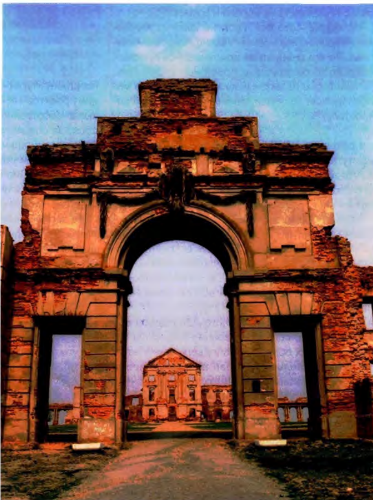
Мал. 1. Брама перад палацам Сапагаў у Ружанах. XVIII ст.

Перасячэнне ніза (парога) – гэта ўжо абрадавае дзеянне, таму пад парог кладуць якую-небудзь рэч. Тое ж дзеянне адбываецца, калі грукаюць аб дзвярныя касякі. Магічнае значэнне надаецца спецыяльнай рэчы над дзвярным пра-