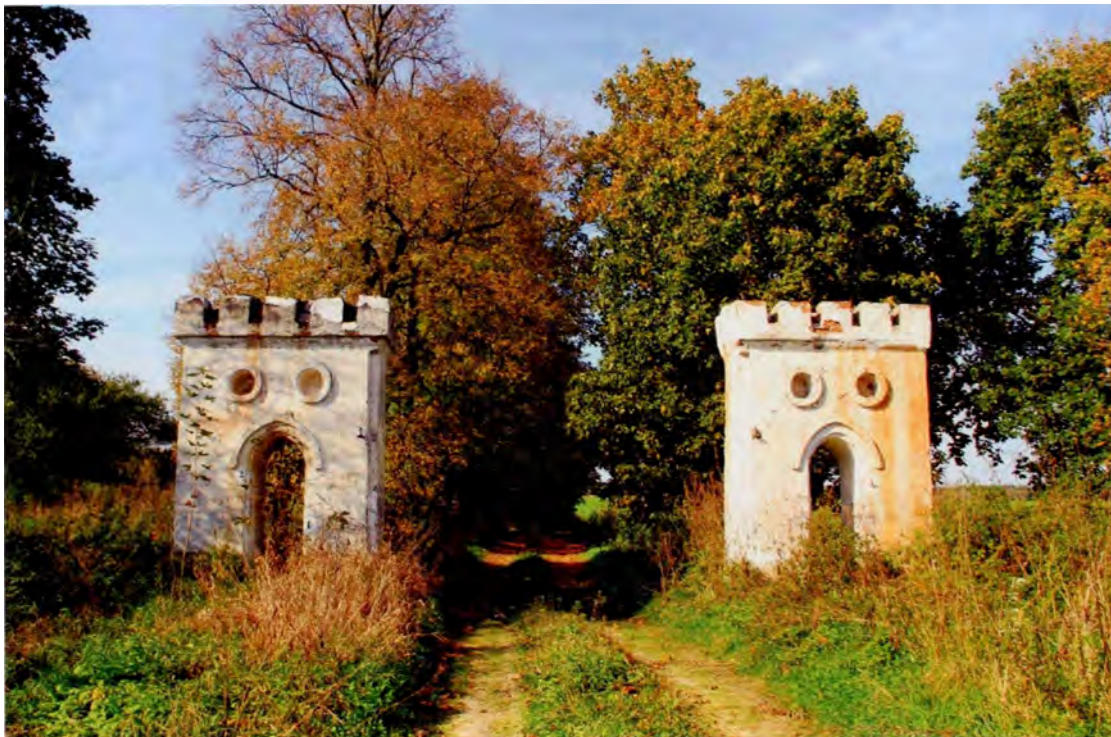
Мал. 6. Паркавая брама. в. Гняздзілава (Докшыцкі р-н). Пач. XX ст.