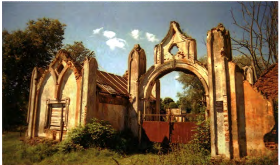
Мал. 10. Брама сядзібы ў Наднёмане (Уздзенскі р-н). XIX ст.

Асабліваць архітэктурны брамаў заключаецца і ў тым, што межавая прырода дазваляе далучаць іх да розных тыпаў асяроддзя – паркавага, гарадскога, сялянскага, адкрытага, закрытага і г.д.*