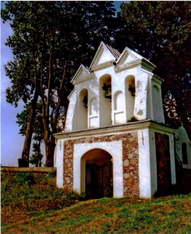
Мал. 12. Брама перад касцёлам у Вішневе (Валожынскі р-н). XIX ст.