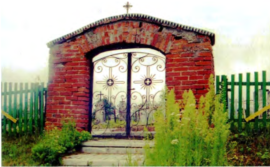
Мал. 14. Моглавая брама ў в. Вяржы (Докшыцкі р-н). Пач. XX ст.