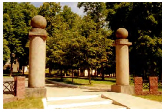
Мал. 5. Брама пры уваходзе у парк. в. Камарова. (Мядзельскі р-н). Пач. XX ст.

Кампазіцыйна брама можа ўключацца ў архітэктурны ансамбль з асноўным будынкам (палац, сядзіба, храм), але гэта не агульнае правіла. Тым не менш важным з'яўляецца менавіта размяшчэнне бра-