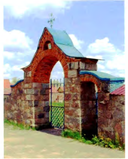
Мал. 13. Брама пры ўваходзе ў царкву в. Княгінін (Мядзельскі р-н). Пач. XX ст.