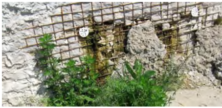
Рис. 3. Разрушение низового открылка левобережного устоя Тетеринской ГЭС