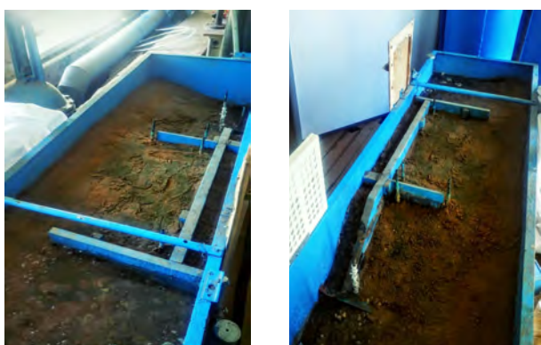
Рис. 5. Общий вид лабораторной установки Fig. 5. General view of laboratory plant

Модель берегового устоя, состоящая из вертикальной продольной стенки, верхового и низового отсыпков и противофильтрационной диафрагмы, выполненная из дерева, примыкает к берегу, отсыпанному из песка средней крупности. Водупором является дно лотка, на котором стоит устой. Вдоль берегового устоя размещаются семь пьезометров, первый и седьмой из которых фиксируют глубину воды