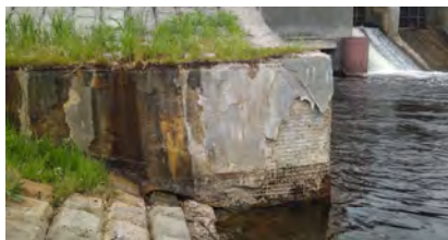
Рис. 4. Низовой открылок правобережного устоя Клястицкой ГЭС

В неудовлетворительном состоянии находится и низовой открылок правобережного устоя Клястицкой ГЭС (рис. 4), где также происходят выщелачивание бетона, разрушение и отслаивание штукатурки.