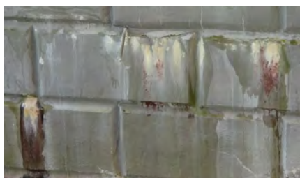
Рис. 2. Подтеки на низовом открылке правобережного устоя