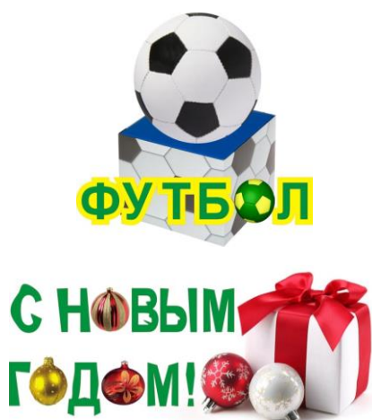
Рис. 4. Примеры пиктографической реализации буквы «о»

2. Параграфемный элемент – это знак какой-то другой знаковой системы, который до попадания в текст имел свое «первичное значение», т. е. так называемые первичные десигнат и денотат. Это соответственно: знак знаковой системы и конкретная функция, скрывающаяся за этим знаком. Это могут быть компьютерная, языковая, музыкальная функции, или какие-то указания (правила дорожного движения), или обозначение некоторого количества, если это цифры, и т. д. Когда же знак попадает в текст и становится параграфемным элементом, он либо полностью теряет, либо частично сохраняет свое первоначальное значение, за счет которого осуществляется связь параграфемного элемента с контекстом. То есть десигнат знака остается прежний – это знак знаковой системы, тогда как денотат меняется – это, как правило, частичное обозначение «первичной» функции и дополнительное значение. Например, значок «@» в слове «п@рни» на праздничном плакате, который содержит следующий текст: «П@рни, с Новым годом!». Можно, конечно, предположить, что, применяя этот значок, молодые люди хотели подчеркнуть свою принадлежность к компьютерной сфере (рис. 5).