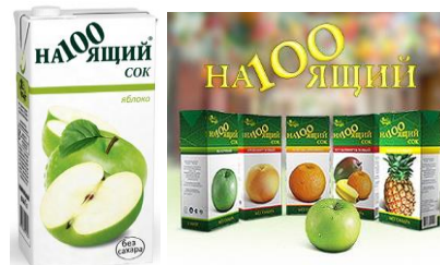
Рис. 6. Упаковка сока со словом «на100ящий»

«наСТОящий». В этом случае никакого дополнительного значения он не приобретает и не привносит в слово, точнее сказать, – значок теряет свой денотат в данном контексте (рис. 6).