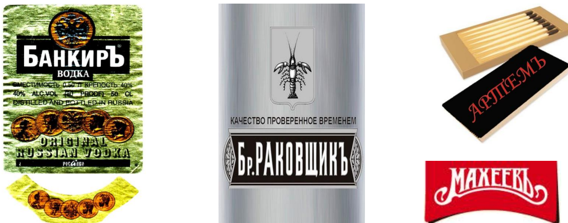
Рис. 2. Примеры текста на упаковке с элементами старой орфографии

1. Параграфемные элементы, которые имеют десигнатом класс объектов реальной действительности, а денотатом – конкретный член этого класса объектов. Например, в слове «футбол» букву «о» заменяет футбольный мяч, а в словосочетании «С Новым годом!» букву «о» – елочная игрушка, неизменный атрибут Нового года (рис. 4).