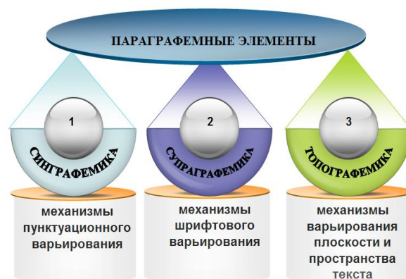
Рис. 1. Основные группы параграфемных элементов

Исследователи параграфемии выделяют три основные группы параграфемных элементов, с помощью которых создается воздействующий эффект рекламного текста: синграфемика, супраграфемика, топографемика (рис. 1).