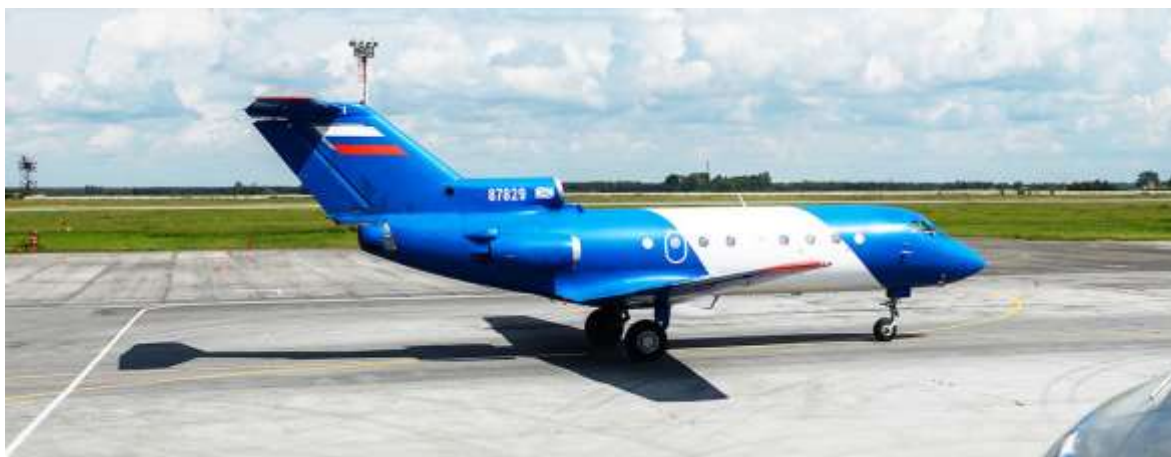
Рисунок 2. Як 40

Осенью 2020 в России запланированы лётные испытания гибридного авиационного двигателя. Агрегат будет установлен на летающую лабораторию, которая создаётся на базе пассажирского самолёта Як-40. Предполагается, что гибридный двигатель позволит значительно уменьшить расход топлива и снизить стоимость перевозок. Мощность изделия составляет 500 кВт, но учёные планируют увеличить этот показатель.