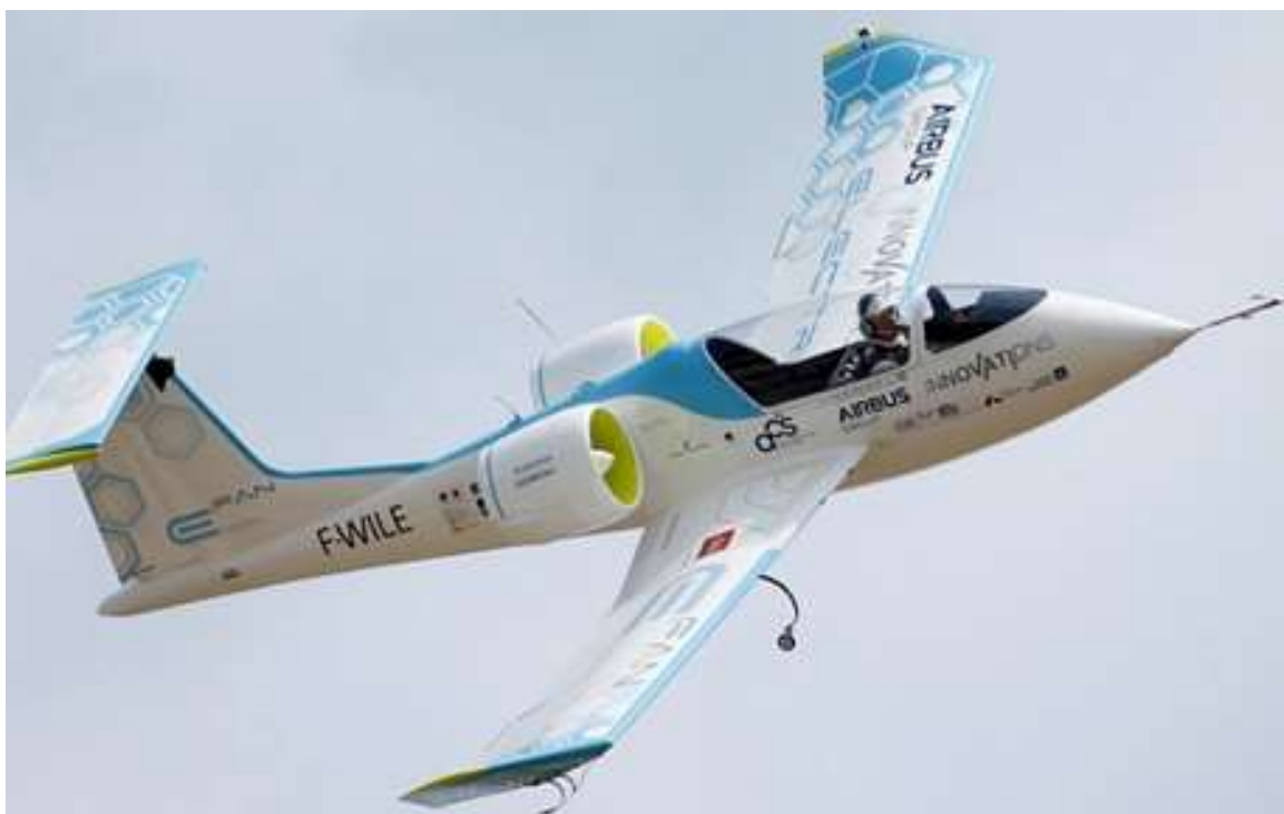
Рисунок 4. Двухместный электрический самолет E-Fan

электробатарей, так и топливные элементы. Эта технология нуждается еще в значительной доработке и дополнительных исследованиях.