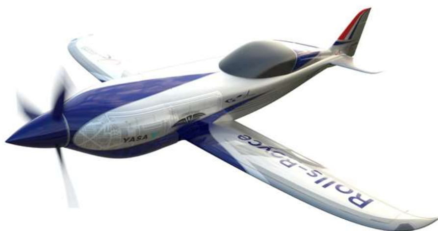
Рисунок 3. ЛА Siemens Extra 330LE

На сегодняшний день важным вопросом является уменьшение выбросов загрязняющих веществ в атмосферу и экономичности установок, что привлекает внимание к использованию гибридных силовых установок в летательных аппаратах.