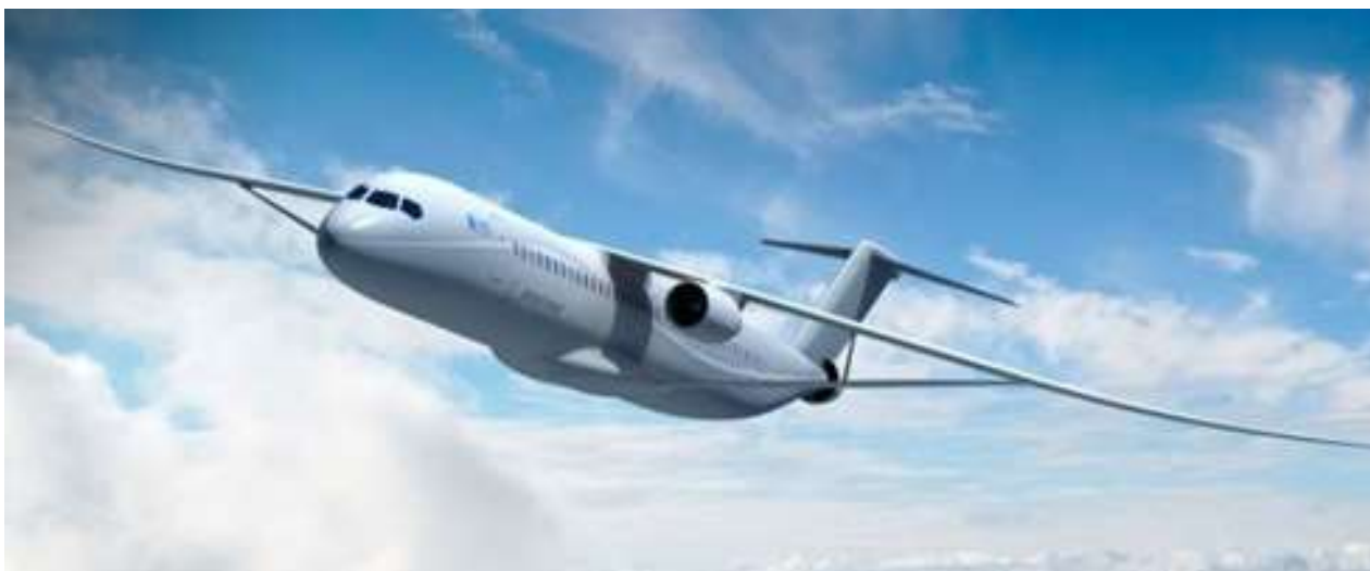
Рисунок 5. SUGAR Volt «subsonic ultra-green aircraft research» – «исследование по созданию дозвукового весьма экологичного самолёта»

Перспективой является создание «интеллектуальные лайнеров» самостоятельно прокладывающих маршруты исходя из параметров экологичности и топливной эффективности на основе анализа данных о погоде и состоянии атмосферы.