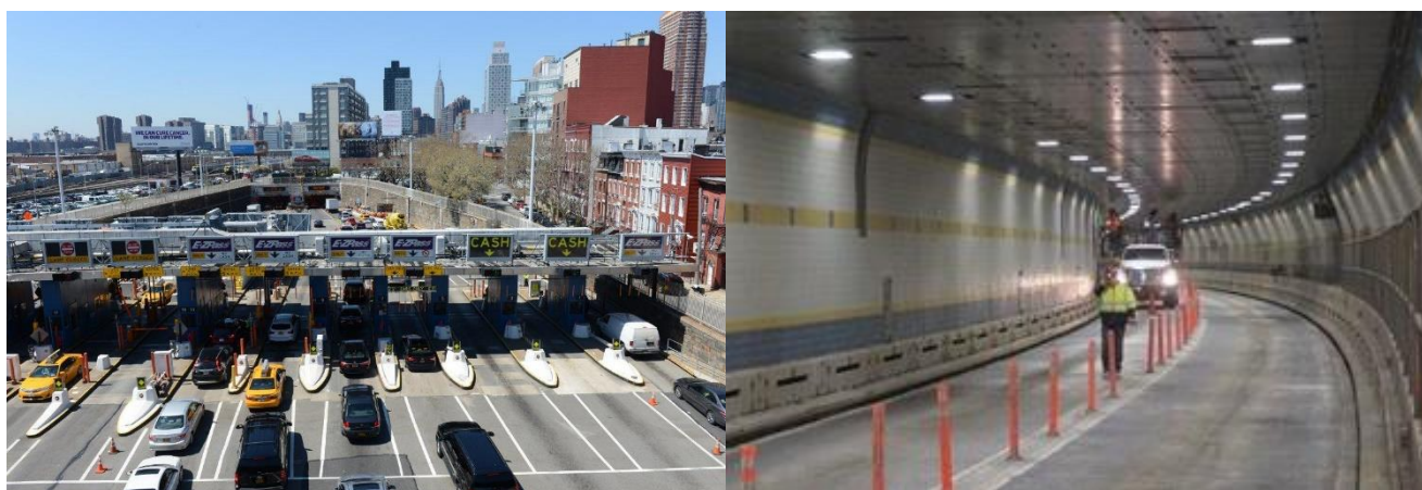
Рисунок 2 – Тоннель Куинс-Мидтаун

Проект был разработан архитектором Оле Сингстадом. Начало строительства было проведено второго октября 1936 года. На церемонии открытия присутствовал президент Соединённых Штатов Америки Рузвельт. В строительстве применялись передовые, на тот момент, технологии вследствие чего строительство закончилось за четыре года. 15 ноября 1940 года было открытие. В конце 1998 года по 2004 год в тоннеле проводились реконструкционные работы, был укреплен потолок, улучшены освещение и пожарная защита. (Рис. 2).