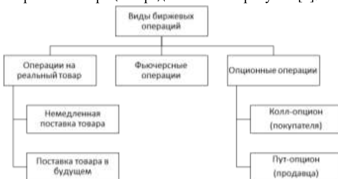
Рисунок 1 – Виды биржевых операций

Виды биржевых операций представлены на рисунке [1].