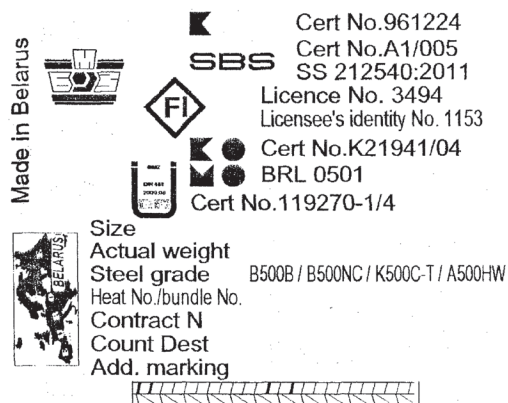
Рис. 2. Внешний вид унифицированной бирки для арматуры Y500-5 (укрупненный пакет)

Исходя из анализа требований стандартов к геометрическим параметрам арматурной стали, были унифицированы нормируемые показатели геометрических размеров и массы погонного метра, на основании которых, в свою очередь, разработана универсальная нарезка калибров прокатных валков. Это позволило получить периодический профиль с геометрическими характеристиками, удовлетворяющими требованиям пяти стандартов и обеспечить получение фактической относительной площади поперечного сечения f_R более 0,068 для диаметра 10 мм и более 0,073 для диаметров 12–32 мм.