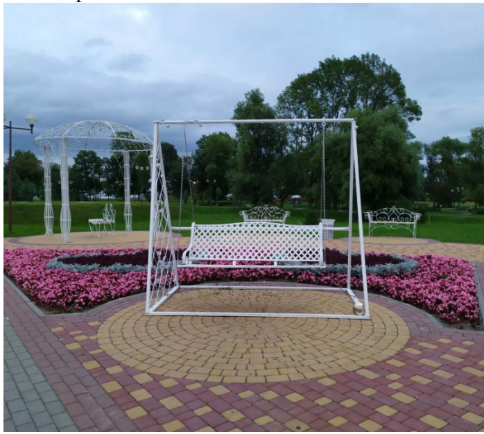
Рис. 2. Свадебная фотозона в парке Подниколье

В современных парках используются разнообразные приемы озеленения – кроме традиционных аллеиных и одиночных посадок, групп и массивов насаждений распространение получают вертикальное и контейнерное озеленение, создание садов на крышах, водных садов.