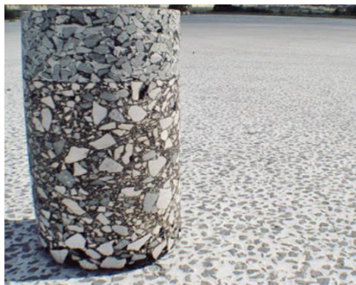
Рис. 1. Асфальтоцементобетон (вид готового покрытия)

Асфальтоцементобетон (АЦБ) – это комплексный строительный материал, совмещающий в себе свойства асфальтобетона и цементобетона. Основой данного материала является высокопористый дренирующий асфальтобетон, выполняющий роль каркаса (по своему гранулометрическому составу асфальтобетонная смесь в составе асфальтоцементобетона больше похожа на черный щебень), пустоты заполняет высокопрочный цементный раствор — наполнитель.