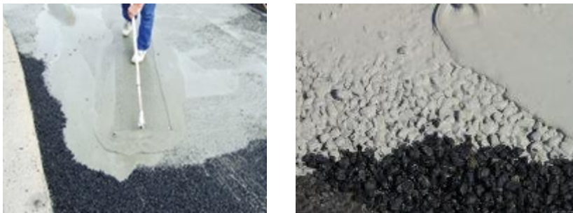
Рис. 3. Пропитка асфальтобетона цементным раствором

После остывания асфальтобетона до температуры равной 25–30 °С можно приступить к нанесению цементного раствора. При температуре, превышающей этот предел, начнутся процессы приводящие к быстрому испарению воды и как следствию снижению текучести. А из-за этого раствор хуже заполнит поры, а также значительно потеряет в прочности.