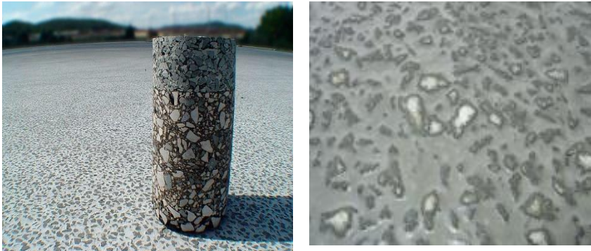
Рис. 4. Вид готового асфальтоцементобетонного покрытия

Последовательная технология выполнения работ представлена на рисунке 5.