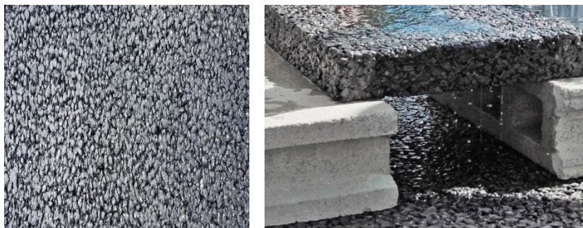
Рис. 2. Слои асфальтобетона из смесей специального состава, фрагмент покрытия

Асфальтирование происходит традиционно, с применением асфальтоукладчиков. Укладка в труднодоступных местах производится вручную.