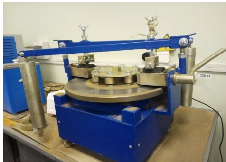
Рис. 1. Лабораторный круг истирания ЛКИ-3: 1 – истирающий диск; 2 – испытуемые образцы; 3 – нагружающее устройство; 4 – счетчик оборотов;