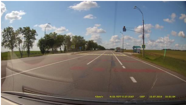
Рисунок 1 – Пешеходный переход на км 17,696 Р-23 Минск – Микашевичи

Исследуемый участок – нерегулируемый обозначенный пешеходный переход в одном уровне через автомобильную дорогу республиканского значения Р-23 Минск – Микашевичи на км 17,696 (рисунок 1). На рисунке 2 представлены результаты исследования размещения ТСОДД на исследуемом участке.