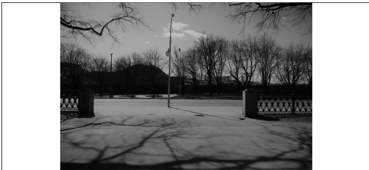
Рисунок 4. Сквер Марата Казея, 16.00-17.30, 16 апреля 2020 года

В утренние будние дни маловато людей, поэтому решила рассмотреть входы в сквер. Интересно, чем обусловлено такое расположение. Первый и самый явный находится в северном секторе, прямо возле троллейбусной остановки. Достаточно много людей попадают в сквер именно через этот вход, недалеко находится жилая застройка. Второй, будем называть его западный, загадочно открывает вид на монумент Марата Казея, но, увы, им почти никто не пользуется, пешеходный переход находится прямо около первого входа, никто не видит смысла пройти ещё пару метров, в принципе я тоже. Третий вход, южный, самый необычный и самый немногочисленный. Пешеходные переходы находятся далековато, вход сразу же направляет нас прямо на монумент, ну и заканчивает весь наш ансамбль фонарный столб, который режет наш вход, да и всю нашу аллею, на две равные части. Неявными я назвала входы, образованные с помощью набережной, которая тянется через весь Водно-Зелёный Диаметр. На набережной я встретила лишь одну женщину в официально-деловом костюме, шла она быстро и уверенно, вряд ли это была утренняя прогулка. А в глубине сквера прогуливался мужчина в спортивном костюме, громко обсуждая работу по телефону, помешать он мог только птицам, в это время дня.