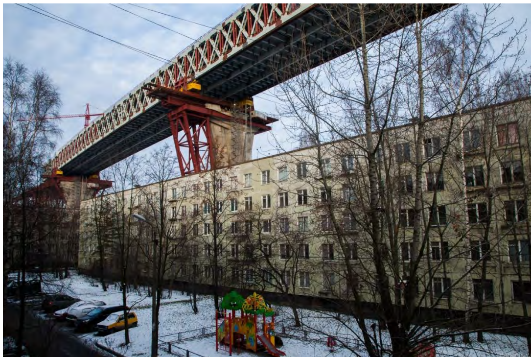
Рисунок 2 – Надвигка над домами

В связи со стеснёнными условиями городской среды Канонерского острова, проектировщиками было принято решение установить через Морской канал двухъярусную семипролётную металлическую ферму длиной около километра. Сборка конструкции проводилась на стапеле на высоте более 40 м над землёй, и осуществлялась методом надвигки непосредственно над жилыми домами. (Рис. 2).