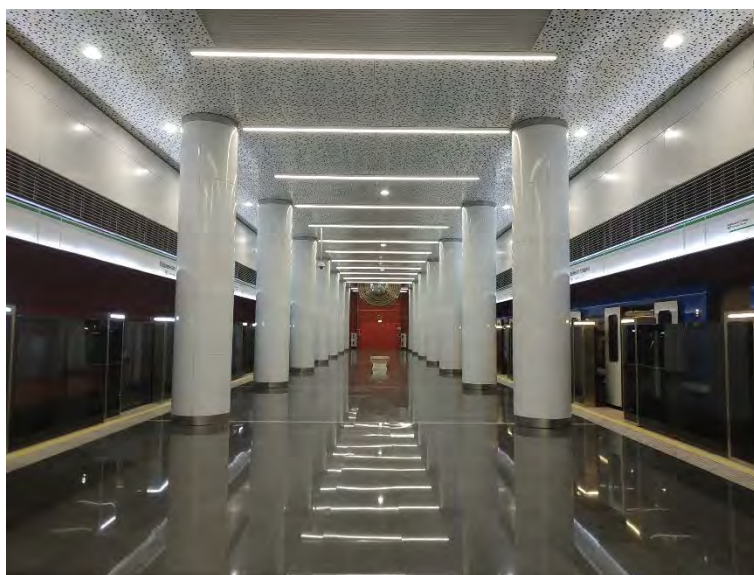
Рисунок 5 – Станция «Юбилейная площадь»

Приближаемся к станции «Юбилейная площадь». Это самая глубокая станция в нашей столице- 32 метра. Здесь также можно увидеть замечательную скульптуру «Солнце» Максима Петруля. (Рис.5)