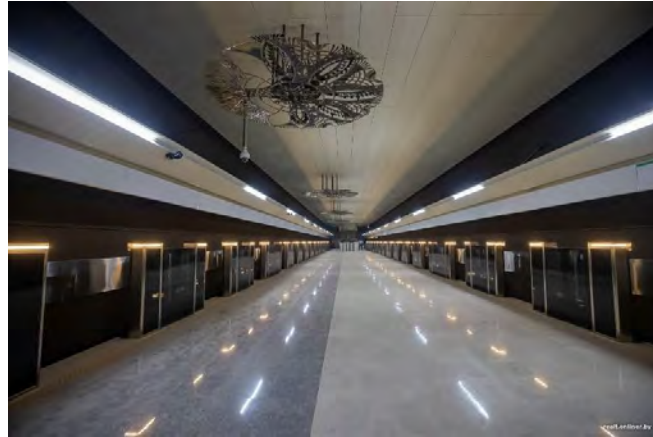
Рисунок 2 – Станция «Ковальская слабода»

отсутствием колонн. Здесь очень просторно. Кованые конструкции украшают платформу, выполненные Павлом Войницким и Марией Тарлецкой. На стенах графические работы, выполненные на противоударном стекле, Марины Жвирбля.