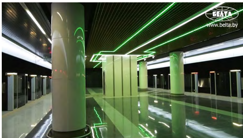
Рисунок 4 – Станция «Площадь Францишка Богушевича»

Приближаемся к станции «Юбилейная площадь». Это самая глубокая станция в нашей столице- 32 метра. Здесь также можно увидеть замечательную скульптуру «Солнце» Максима Петруля. (Рис.5)