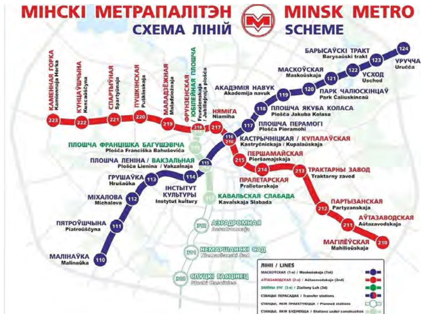
Рисунок 1 – Схема линий метро

Строительство минского метрополитена началось 3 мая 1977 г. А 29 июня 1984 г. была запущена первая линия, протяженность которой была 7,84 километра и насчитывала восемь станций. В 1985 г. начато строительство второй линии и в 1990 г. 31 декабря вторая линия была открыта. В настоящее время две ветки минского метро имеют протяженность 37,3 километра и насчитывает 29 станций. И спустя много лет, 6 ноября 2020 года состоялось открытие третьей линии метро «Зеленолужской». Пока работают только 4 станции. Всего Зеленолужская линия должна будет разрастись до 14 станций. Линия соединяет центр Минска и его южные и северные районы. На схеме метрополитена линия обозначена зеленым цветом. (Рис.1)