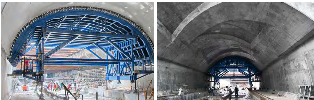
Рисунок 1 – Механизированный опалубочный комплекс СТАЛФОРМ Инт

Катушечная тоннельная опалубка позволяет механизировать строительство монолитных железобетонных сводов тоннелей различного профиля и сечения. Также данная опалубка позволяет увеличить уровень безопасности производства работ на всех этапах. Высокое качество полученной бетонной поверхности зависит от материалов, из которых изготовлены модули тоннельной опалубки. Благодаря качеству опалубки легко получить точные размеры и габариты тоннеля. (Рис. 1).