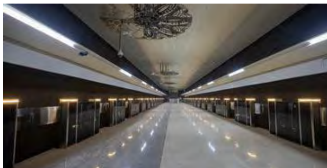
Рисунок 1 – Станция «Ковальская слобода»

Количество кованных элементов соответствует названию станции — «Ковальская слобода».