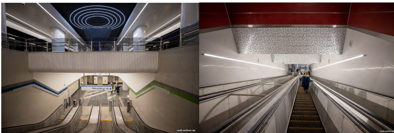
Рисунок 4 – Станция «Юбилейная»

Благодаря цветовым обозначениям направлений, пассажирам будет легко ориентироваться. Если вам нужно перейти на синюю ветку — следуй за синей полосой. Нужна зеленая — та же ситуация.