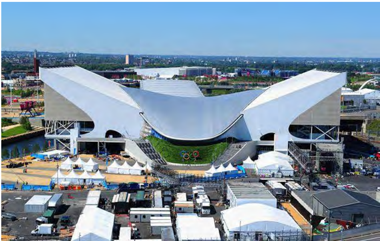
Рисунок 3 – Центр водных видов спорта, вид сбоку

Лондонский центр водных видов спорта выглядит завораживающе и его по праву можно назвать «архитектурным искусством».