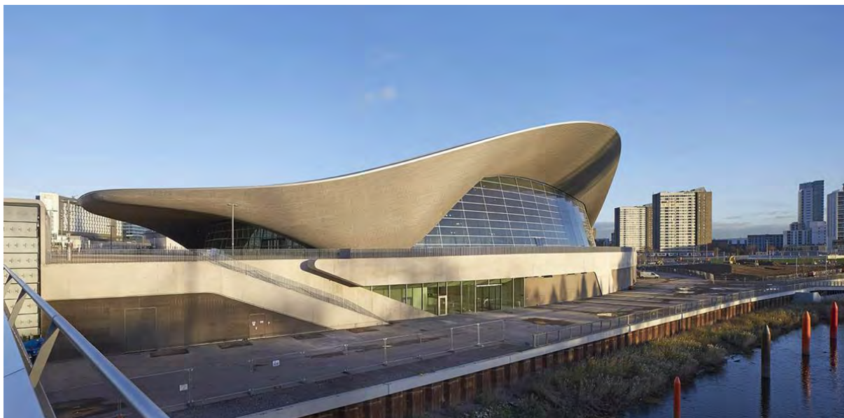
Рисунок 1 – Центр водных видов спорта

Одним из самых красивых сооружений в Олимпийском парке стал центр водных видов спорта.