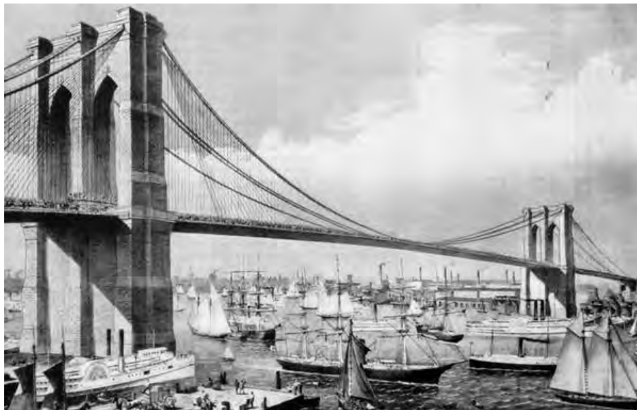
Рисунок 2 – Бруклинский мост в древности

сожалению, сам архитектор не успел увидеть даже начала строительства, он умер в 1869 году. Дело своего отца продолжил его сын – Вашингтон Роблинг. Строительные работы продолжались долгие тринадцать лет. Торжественное открытие Бруклинского моста состоялось 24 мая 1883 года. (Рис. 2)