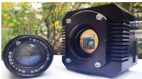
Рисунок 2 – Внешний вид тепловизора

Внешний вид тепловизора приведен на рисунке 2.