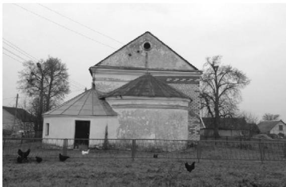
Мал. 4. Капліца ў в. Ужанка. Выгляд збоку апсіды

Так на адным з фатаздымкаў 1990 г. выразна бачны з абодвух бакоў ад дзвярэй, закладзеныя ўжо ў той час нішы ў якіх размяшчаліся статуі святых.