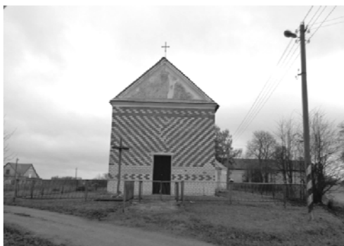
Мал. 3. Капліца ў в. Ужанка.

XIX ст. [9, с. 50], а ў Расійскім дзяржаўным архіве старажытных актаў захоўваецца інвентар фальварка Ужанка ня-свіжскага езуіцкага калегіума, складзены 20 кастрычніка 1773 г., у якім адзначаецца, што на той час тут быў невялікі касцёл у гонар Яна Хрысціцеля, кароткая візітацыя якога падаецца ў інвентары [10, арк. 3–5].