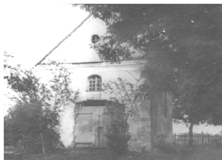
Мал. 1. Фатаграфія 1949 г. капліцы св. Ізидора.

завершанае паўкруглай аркай. Па цэнтры трохвугольных фронтонаў з абодвух бакоў знаходзіліся круглыя вокны дыяметрам каля 1 м. Апсіды каплічка не мела [8]. Хто быў аўтарам праекта гэтай капліцы невядома.