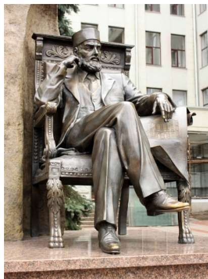
Рис. 2. Памятник А.Н. Бекетову около входа в главный корпус Харьковского государственного технического университета строительства и архитектуры. 2007 г.

Существенный вклад в формирование нового типа зданий банков внес академик архитектуры Алексей Николаевич Бекетов (1862-1941). Выдающийся зодчий, профессор Санкт-Петербургской Императорской Академии художеств, академик архитектуры – он оставил в наследие обширный перечень научных трудов, стоял у истоков архитектурного образования в Украине, вел активную научную и преподавательскую деятельность, воспитал плеяду молодых архитекторов (рис. 2).