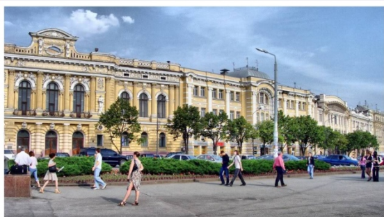
Площадь Конституции (бывшая Николаевская пл.) в Харькове. На фото здания Земельного, Торгового и Волжско-Камского банков. Арх. А.Н. Бекетов. Современное состояние.