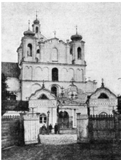
Рис. 6. Свято-Богоявленский монастырь. Фото начала XX в. [12, с. 20]

питаля и дом настоятеля монастыря, а также несколько зданий лавок и хозяйственные постройки [11].