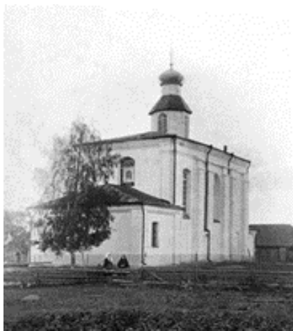
Рис. 1. Церковь Параскевы-Пятницы [3, с. 39]

что собор в Бельчицах был следующей по времени постройкой после Софийского собора, далее строились непосредственно храмы княжеского двора – Борисо-Глебский и Пятницкий. Четвёртый храм монастыря – триконх. Такой тип постройки, имеющий в середине северной и южной стены круглые выступы – конхи, характерен для церковной архитектуры Болгарии, Румынии, Сербии [6, с. 123].