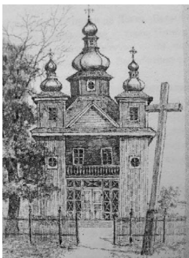
Рис. 4. Свято-Успенская церковь [9, с. 28]

Монастырь был сильно разрушен во время татарского нашествия в 1540 г. В 1648 г. в г. Пинске был большой пожар, вследствие подавления восстания горожан, а в 1655 г. город подвергся штурму