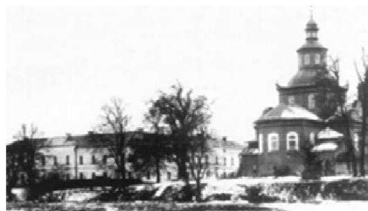
Рис. 5. Свято-Троицкий монастырь. Фото начала XX в.

вичей основана школа. В ней изучались грамматика (славянская и греческая), риторика, диалектика. Киевский митрополит Дионисий Балабан основал при монастыре Духовную консисторию, которая просуществовала до 1789 г. В мае 1785 г. указом императрицы Екатерины было предписано Синоду «учредить для пользы Церкви Православной и просвещения исповедающих закон наш в Польше Семинарию». С 1793 г. семинария возобновила свою деятельность [1].