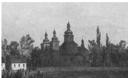
Рис. 3. Вид на Свято-Успенский монастырь со стороны р. Пины [9, с. 26]

По инвентарю 26.12.1588 г. был полностью деревянным. Двор окружён дылями, в ограду встроена двухъярусная брама-звонница с пятью колоколами. Имелось две церкви: главная Свято-Успенская (упоминается в летописи в 1263 г., построена заново в 1580 г. после разорения татарами на том же месте, существовала ещё в конце XIX в.) и «тёплая» Свято-Духовская, соединённая с монастырской трапезной. Справа от брамы стоял жилой монастырский корпус, слева – дом архимандрита. Кроме этого на монастырском дворе располагались срубные стайня, баня, пивоварня. За стенами монастыря находились дом священника, гумно, сад, огород и лес [9, с. 24; 8, с. 263].