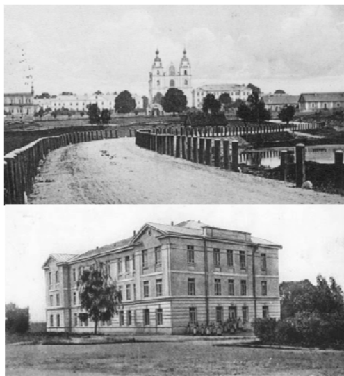
Рис. 7. Красностокский Рождество-Богородичный монастырь. Фото начала XX в [15]

формирования и развития является важным для современного развития духовно-просветительского и социального служения Белорусской Православной Церкви.