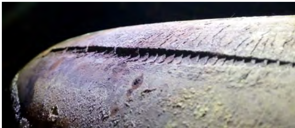
Рисунок 1 – Надрыв металла растянутой частигиба вызванный попаданием инородного тела высокой твердости в трубогиб.

Необогреваемые гибы котлов работают в сложно нагруженных условиях которые характеризуются: перепадами температур, механическим воздействием транспортируемой среды, а также неравномерностью изначальных свойств вследствие процесса холодной деформации при изготовлении (рисунок 1).