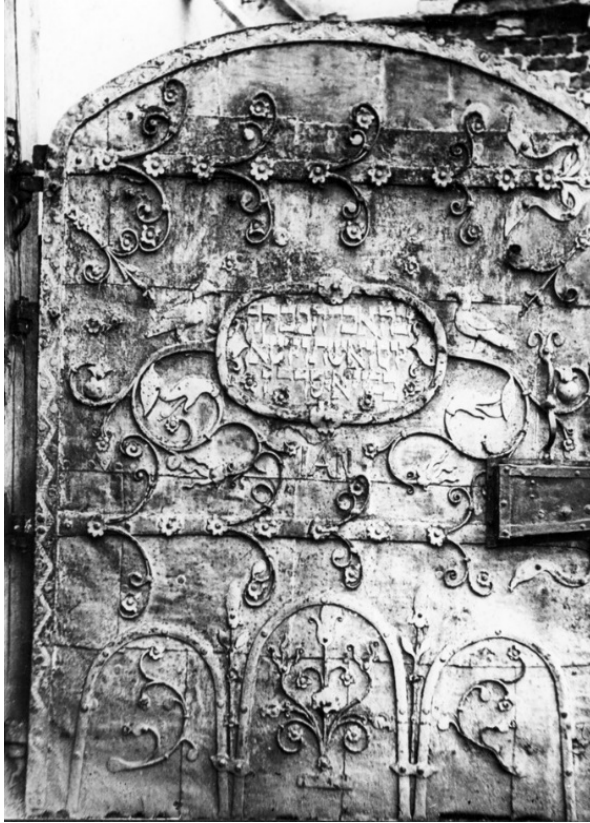
Мал. 1. Дзверы сiнагогі Старога Быхава

Дзверы сiнагогі ў Старым Быхаве не захавалiся. Iх фотаздымак быў зроблены даследчыкам мастацтва А.У. Вiнэрам у 1937 г. [3, с. 95, 101], (мал. 1).