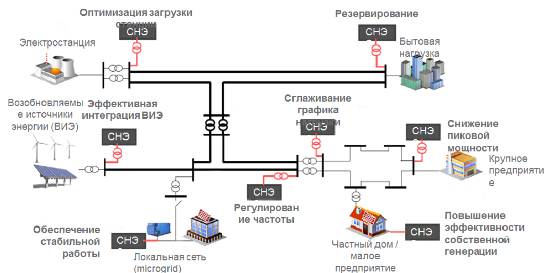
Рисунок 2 – Использование ВИЭ на всех уровнях энергосистемы

БелАЭС), обеспечение баланса мощности, а так же аккумулярование излишне вырабатываемой энергии ВИЭ (рис. 2).