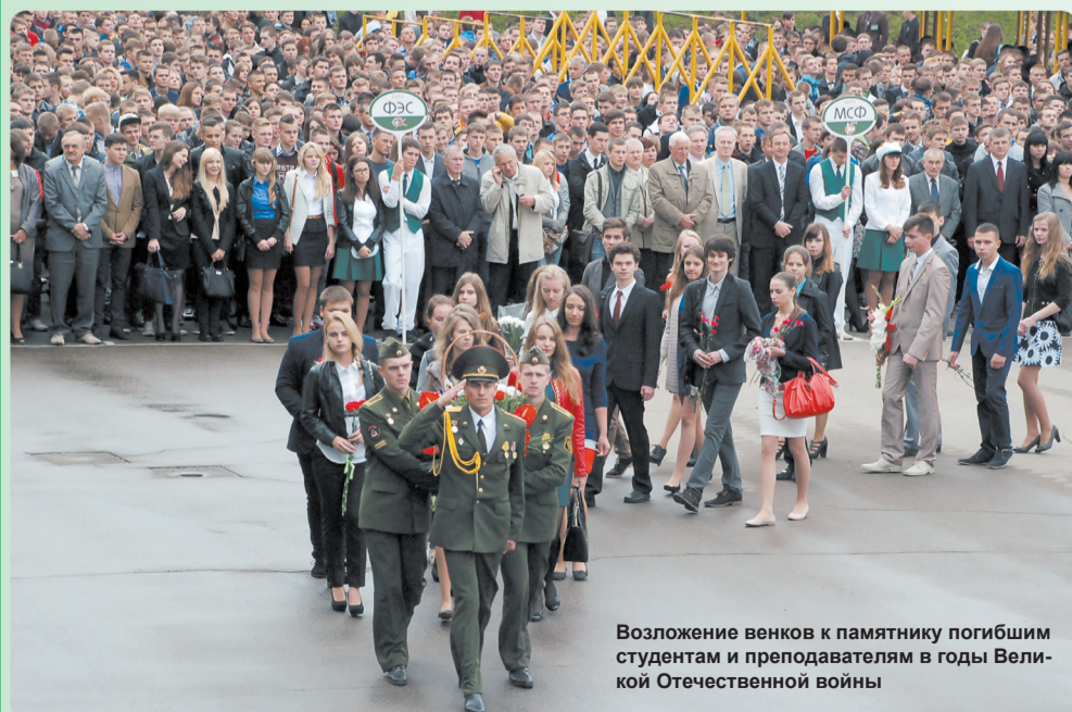
Возложение венков к памятнику погибшим студентам и преподавателям в годы Великой Отечественной войны

Яркими и оптимистичными были выступления ректора БНТУ, академика Национальной академии наук Беларуси, члена Национального