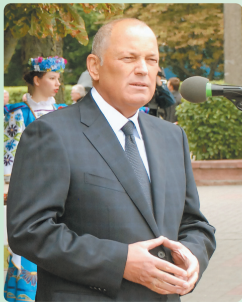
Ректор БНТУ, академик НАН Беларуси Б.М. Хрусталёв

Б.М.Хрусталев, академик НАН Беларуси: «Вступительная кампания в Политехе прошла честно и без существенных нарушений, а поправки в правила приема полностью себя оправдали».