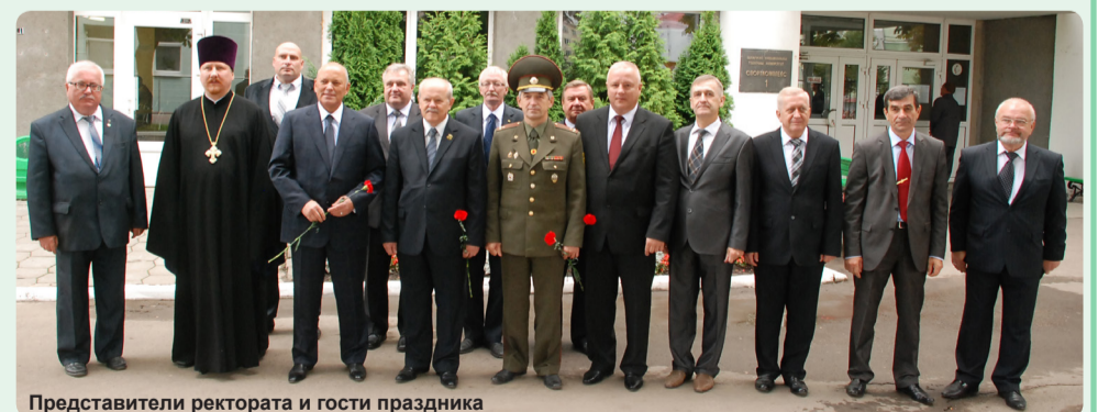
Представители ректората и гости праздника