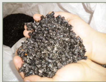
Добавки для модификации асфальтобетонных смесей и битумов

На сегодня у нас имеются свои истории успеха. На основе идей, вынесенных из научно-иссле-