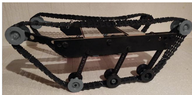
Рис 2. Вид готовой платформы

Платформа смоделирована при помощи программ SketchUp и 3Ds Max. Крайне важно было выбрать достаточно прочный и лёгкий материал, который максимально не подвержен воздействию окружающей среды и ультрафиолетовому излучению. В результате прототип представляет из себя платформу на гусеничном ходу, напечатанную в основном из пластика PETG. В ходе практических испытаний выяснилось, что выполнение функциональных деталей из пластика PETG нецелесообразно, так как они не выдерживают прилагаемых усилий и разрушаются (шестерни, например). Такие детали могут быть выполнены из нейлона (Nylon), который, однако, значительно прихотливее в печати и дороже по цене. Использование комбинации PETG и Nylon на текущий момент показало себя наилучшим образом при подключении моторов и проверке платформы на прочность.