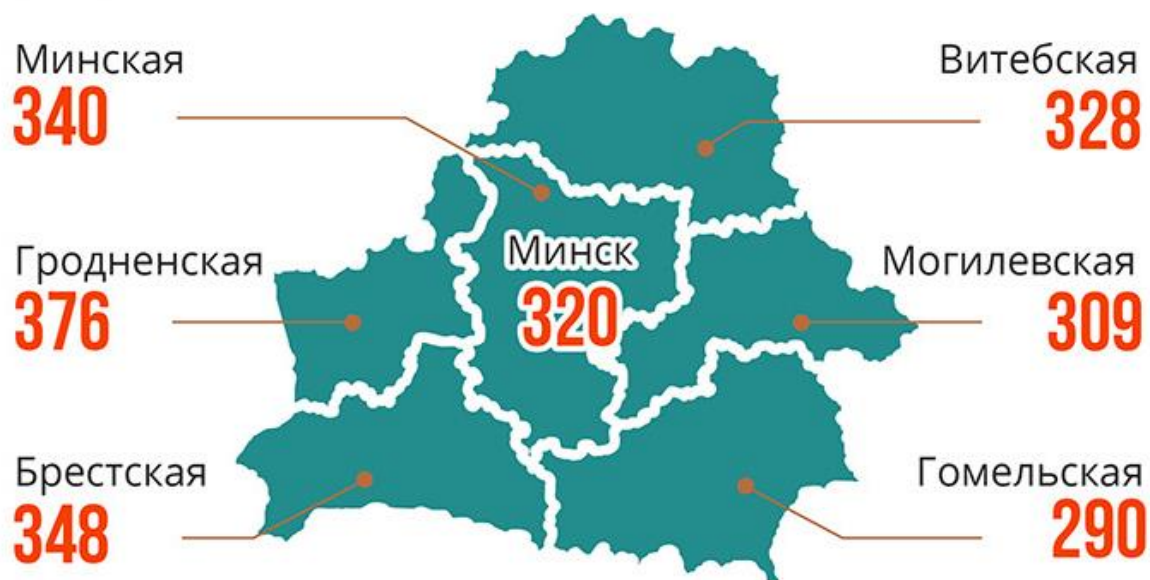
Рисунок 2 – Обеспеченность населения легковыми автомобилями по областям и Минску

В мире насчитывается более 7 млрд человек и 1,2 млрд легковых автомобилей. Уровень автомобилизации в среднем около 170 автомобилей на 1000 жителей. Автомобилизация Беларуси в 2 раза выше, чем в среднем по миру. Самый большой количество автомобилей в США (252,7 млн. штук) и Китае (101,4 млн. штук). Самая низкая обеспеченность населения автомобилями в Африке (менее 10 на 1000 жителей). Лидером рейтинга по обеспеченности автомобилями в Европе оказалась Исландия (717 шт.). Также на второе и третье место попали Финляндия (604 шт.) и Польша (571 шт.). Высочайшей обеспеченностью автомобилями, свыше 500 автомобилей на тысячу жителей, обладают Япония, Сан-Марино, Финляндия, Монако, США, Новая Зеландия, Мальта, Австрия, Германия, Швейцария, Италия, Словения, Польша, Великобритания, Эстония, Норвегия, Чехия, Бельгия. Здесь каждый второй владеет легковым автомобилем. Беларусь занимает 51-ую строчку мирового рейтинга. Обеспеченность автомобилями ниже белорусского уровня показали из европейских стран только Россия (309 шт.), Украина (245 шт.), Албания (140 шт.), Румыния (261 шт.), Турция (142 шт.).