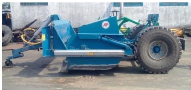
Рисунок 1 – Скрепер фирмы Mashinebouw

Зарубежный опыт показывает успешное применение для ремонта грунтовых дорог малогабаритного прицепного скрепера. Наиболее подходящей моделью для данного вида работ является прицепной скрепер упрощенной конструкции голландской фирмы АП Машинбоув. Объем перевозимого грунта 6 м 3 (рисунок 1). Рабочая ширина ножа 2,3 метра, вес 2 тонны, агрегируется трактором мощностью 80-120 л.с [1].