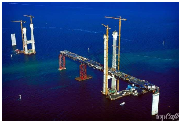
Рисунок 3 – Строительство Эресуннского моста

Данный мост стал связующим звеном между Данией и Швецией. Строительство, начавшееся в 1995 году (Рисунок 3), так же не обошлось без происшествий: когда строители стали забивать сваи, они обнаружили неразорвавшиеся снаряды, но несмотря на это мост был закончен раньше срока и был сдан в эксплуатацию уже 14 августа 1999 года.