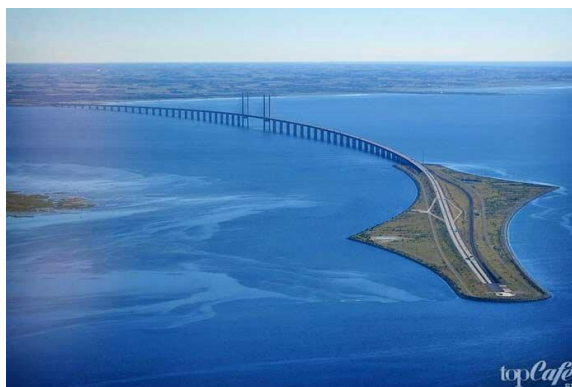
Рисунок 4 – Искусственный остров построенный для Эресуннского моста

Эресуннский мост стал символом объединения Швеции с материковой Европой.