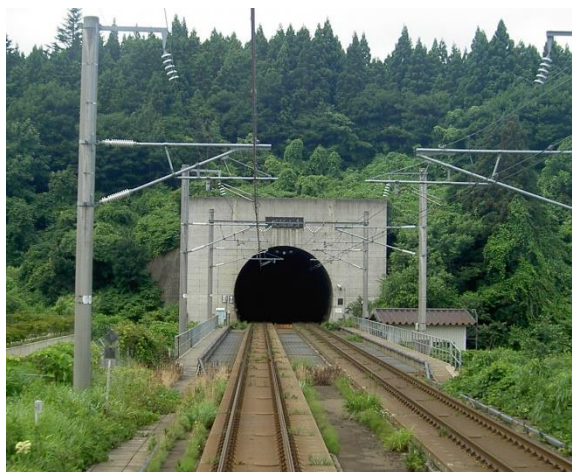
Рисунок 1 – Въезд в тоннель Сэйкан

История строительства этого тоннеля (Рисунок 1), к сожалению, связана с множеством трагедий, произошедших в месте между островами Хонсю и Хоккайдо в Сангарском проливе в 1954 году. В следствии шторма было затоплено 5 паромов, в следствии чего государством было принято решение строительства на тот момент самого длинного железнодорожного тоннеля, протяженностью 54 километра. Его строительство началось в 1964 году, а тоннель вошел в эксплуатацию уже в 1988 году. На сегодняшний день этот тоннель не пользуется особой популярностью среди граждан, однако активно используется самим государством для грузоперевозок.